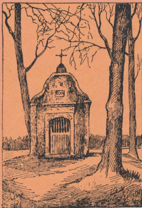
DE KINTSKAPEL TE OPWIJK (1770). (Penttekening van Paul Lindemans.)