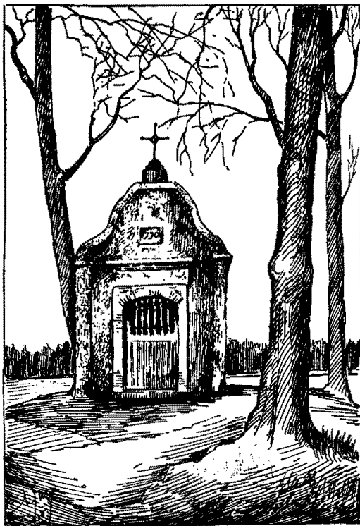
DE KINTSKAPEL TE OPWIJK (1770). (Penteekening van Paul Lindemans.)

rijkere meubileering, zooals blijken zal uit den inventaris dien we beneden mededeelen.