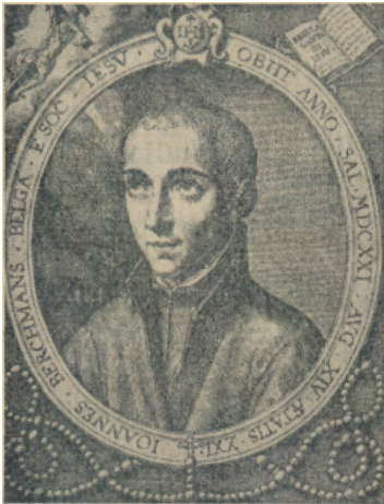
OUDESTE PORTRET (?) VAN SINT JAN BERCHMANS, door A. Wierx (vóór 1624).