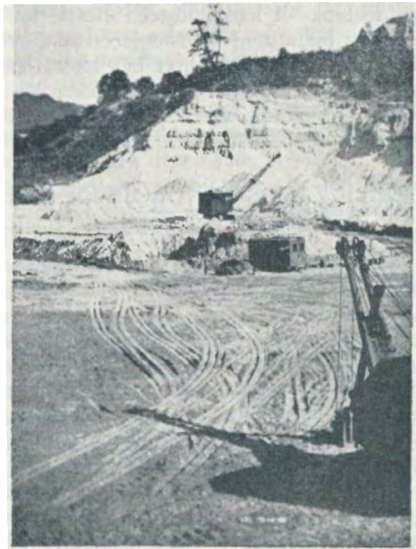
Terreinsectie bij het aanleggen van het gemeentelijk voetbalveld «La Forestoise». De lagen zandsteen zijn duidelijk zichtbaar. 1948.

zandsteengroeven van de omtrek van Brussel in dit oord. Hij vermeldt dat men een kalkoven te Langeveld aantrof, waar de stenen gegloeid werden en een soort mortel leverden, die diende tot bouwstof of meststof der gronden. Hieruit zou men kunnen afleiden dat het ging om betrekkelijk grote hoeveelheden steen en wellicht ook om een kwaliteit die middelmatig was.