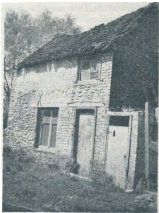
Verdwenen huisje in de Zijdenweverijstraat te Vorst, gedeeltelijk opgebouwd met «zavel- of scheurresteen». foto 1948.

Men ziet dat het delven van witte steen te Vorst ettelijke sporen naliet en niet gauw uit de herinnering zal verdwijnen.