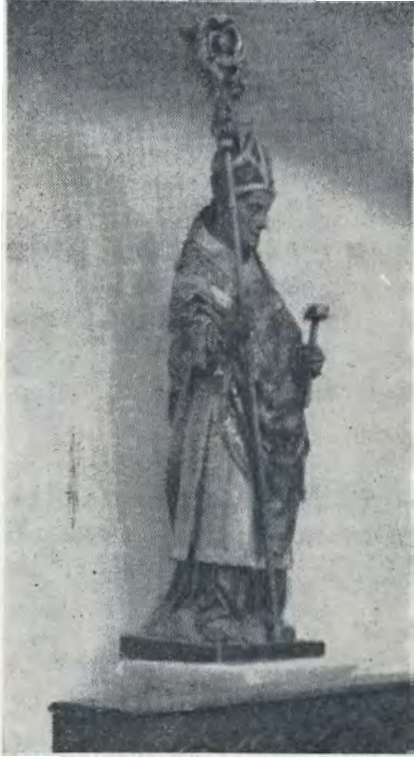
Sint-Michielskerk, Leuven. Beeld van St.-Eligius.

gen van één beroepsvereniging. De eerste stap om in het ambacht te geraken, was de toetreding tot de broederschap. In het midden van de XV e eeuw werd de leerknapp verpllicht als inkomgeld in «de broederschap van Ste Eloij te Wittevrouwen» te geven «een pont was oft gelt daer voere» (11.671-48). Op 18-7-1453 werd besloten dat de «meesters, werckluijden ende goede mannen vanden selven ambachte» de mis van de patroon in de kapel van de Witte Vrouwen moesten bijwonen op boete van een plecke (11.671-49).