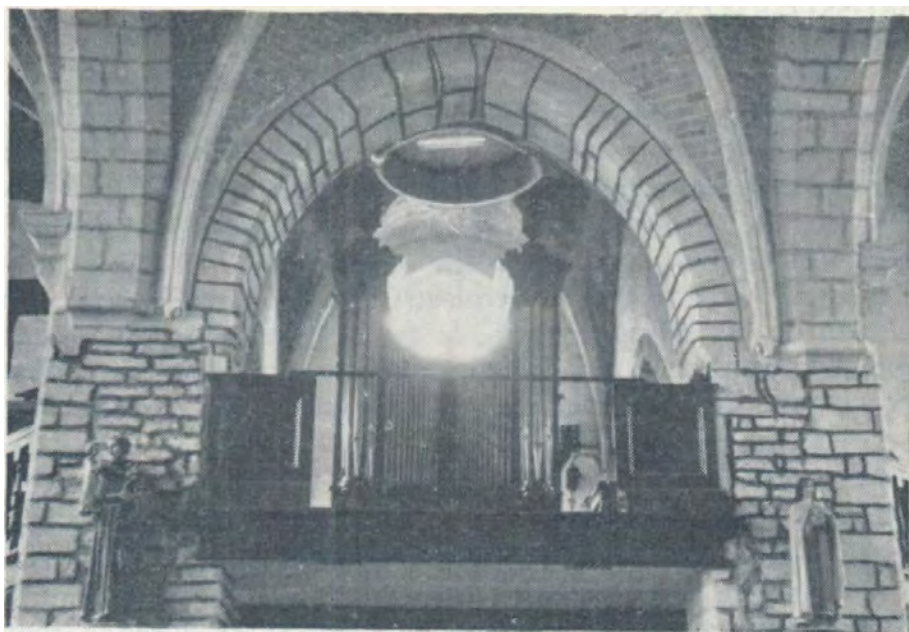
Brussegem - Ossel

kant aan van de Praestant of Doof 4 voet. Daarnaast staat de Praestant 8 voet en enkel in diskant. Dit alles ten gunste van het kleurenspeel.