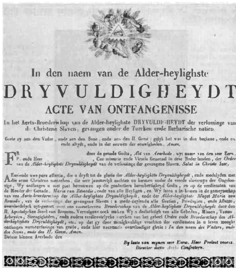
Bewijs van lidmaatschap der Broederschap.

Het nieuwe lid moest bij zijn opname tenminste drie stuivers offeren tot verlossing van de arme Slaven en verder jaarlijks enkele aalmoezen, minstens een halve stuiver, storten in de Slaven-Offer-stock , in de abdijkerk van Averbode (3). Boven het offerblok hing een schilderij, met een voorstelling van de H. Drievuldigheid en twee geboeide slaven. Het onderschrift HIER OFF[E]RT MEN VOOR DE GHEVANGHE SLAVEN moest de gelovigen aansporen tot mildheid (4).