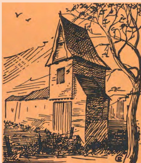
Perk. — Teniershoeve.