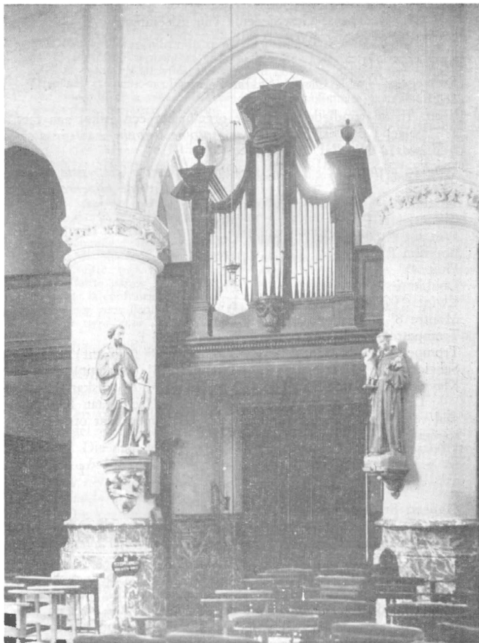
BRUSSEGEM — St.-Stefanus te Oppem

Quinte 2\frac{2}{3} ' Octave 2' Flûte 4' Bourdon 8' Prestant 4' Cornet 4 r.