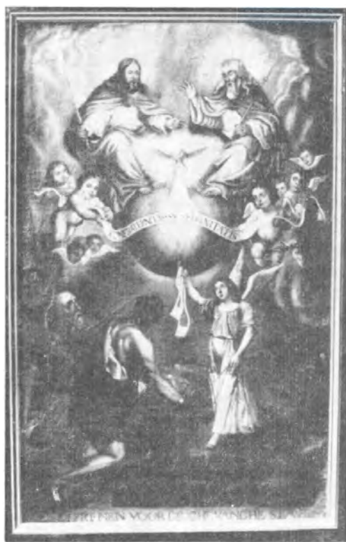
Schilderij der Broederschap (abdijkerk van Averbode).

Prelaat Servatius Vaes (1) werd op 26 september gemachtigd, in de abdijkerk van Averbode, de aartsbroederschap van de Allerheiligste Drievuldigheid tot vrijkoping van de slaven op te richten. Krachtens dit dokument van Fr. Jean de Lessaux, kommissaris en vikaris-generaal van de Trinitariërs in de Zuidelijke Nederlanden, ontvingen de abten van Averbode de toelating, om het schapulier van wit laken, getekend met een kruisje in rood en blauw te zegenen, uit te reiken en op te leggen aan de gelovigen. De abt mocht hiervoor een priester van zijn abdij delegeren (2).