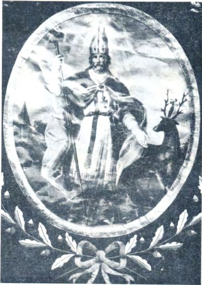
Oud processievaandel van de Broederschap van de H. Hubertus te Buitzingen (Foto J. Steeno, 1963).

Vroeger kon men gewijde St.-Hubertusbroodjes in de kerk zelf bekomen. In 1803 leverde bakker Servais van Halle die broodjes. Later was het bakker Mangelschots van St.-Pieters-