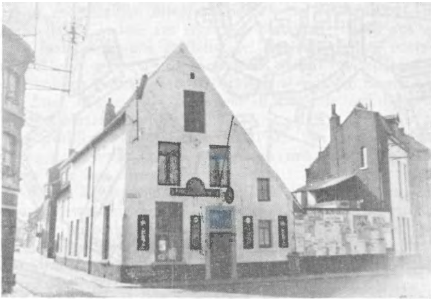
«Het Schip» in januari 1963.