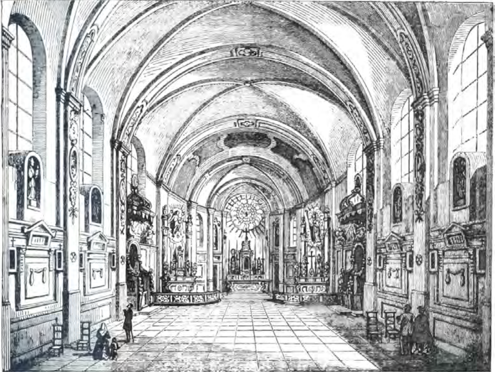
De oude kerk van Buizingen, gesloopt in 1903. Het schip was 14,40 m lang bij 7,50 m breed; het koor 7,30 m lang bij 4,30 m breed. De details van de tekening zijn juist, de verhoudingen minder (Archief pastorie).

In het archief van de Drossaard van Brabant, R.A.B., treft