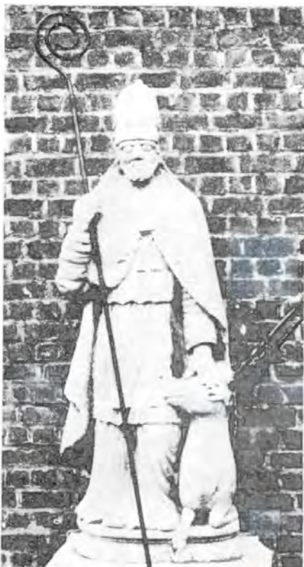
Beeld van de H. Hubertus te Buizingen. Stond oorspronkelyk boven de deur van de oude kerk, gesloopt in 1903. Staat nu nabij de zijingang van de huidige kerk (Foto J. J. Steens, 1963).

In 1829 werden door drukker van der Borgh uit Brussel 200 grote « affichen », op zijn papier, van de H. Hubertus geleverd, evenals goud- en zilver- en gelustreert papier, deze laatste denkelyk om het altaar of het beeld te « paleren ». In 1835 werden er weer 300 van zulke aanplakbrieven gedrukt voor 30 F. Bij die gelegenheid ook nog 100 aanplakbrieven voor de gedurige aanbedding.