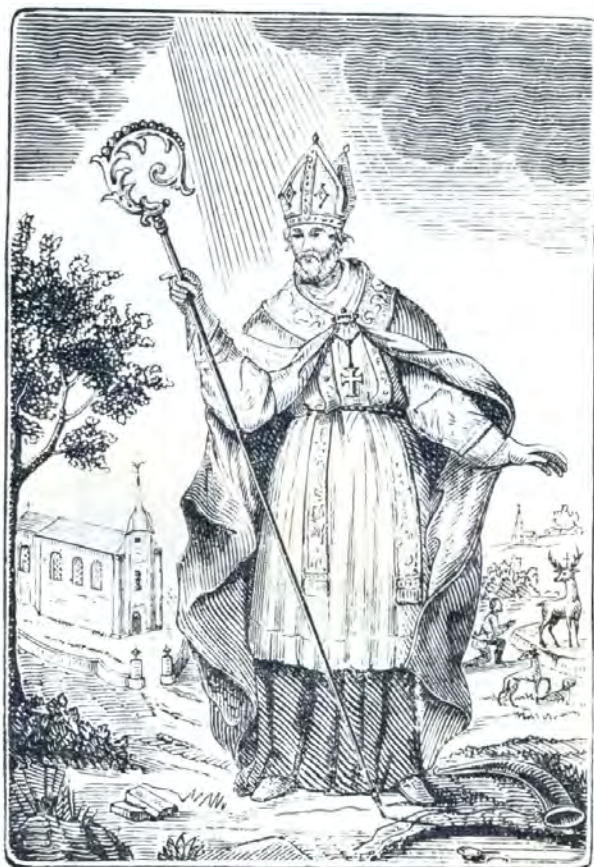
Dit beeldeken heeft geraakt aan de reliquie van den H. HUBERTUS .

In 1767, bij gelegenheid van de oprichting van de Broederschap van de H. Hubertus, werden de relieken van de heilige plechtig ingehaald door pastoor van der Elst (1744-1792), die deze plechtigheid beschrijft als volgt: « In het inhaalen der Reliquien van St Huybrecht wasser een calvacade van cleyne kinderen, ider kint had eenen langen geschilderden stock, waerboven op was een dick grauw pampier geschildert, waer int middel stont geschildert een teeken van de jagers oft van bisschopelijcke gewaed ider met sijn opschrift als in dit bladt; daer waeren altijdt twee kinderen die het zelfste hadden en onder d een stont den text in Latijn en op d ander int Vlaemsch.