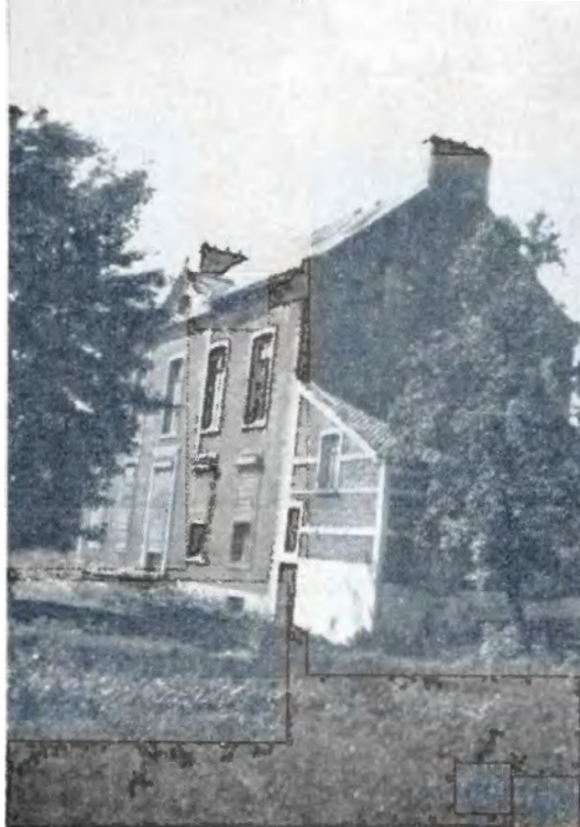
Het meiershuis Lanné. — De aanhorigheden liggen links in de haak met het hoofdgebouw en zijn hier niet zichtbaar. Het in afdak toegevoegd gebouw dateert uit de negentiende eeuw. (Foto 1952).

Het was eertijds een sierlijk, met schaliën bedekt, burgerhuis met zijn stallen en bijgebouwen zoals er vroeger verscheidene op het grondgebied van de gemeente verspreid lagen.