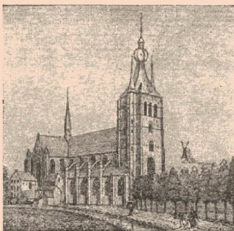
De kerk van Aarschot, van de noordzijde gezien (1838).