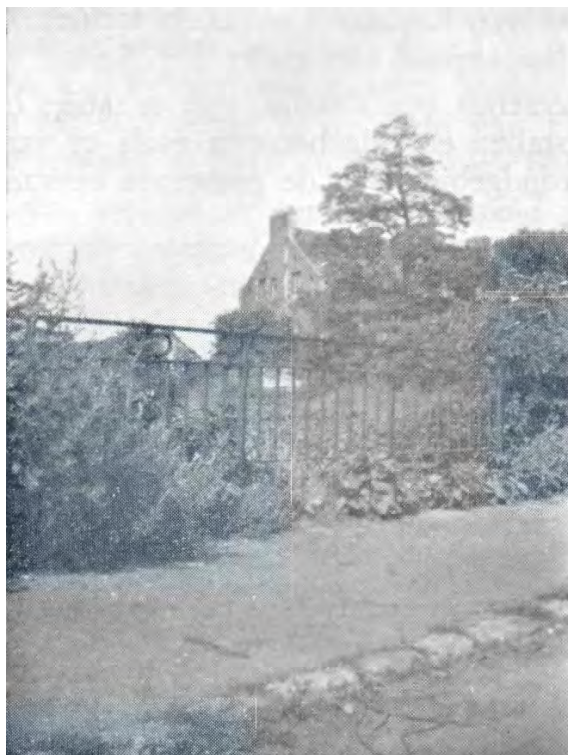
Het brugje over de «Laa» in de Waterstraat. Op de achtergrond het meiershuis Lanné. (Foto 1954).

vroeger in de Waterstraat en is nu verdwenen (zie prent).