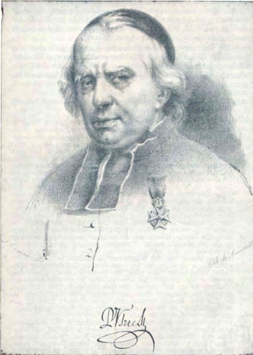
Portret met handtekening van E.H. Petrus Jozef Triest, toen reeds kanunnik Triest.

In 1962 verscheen op onze briefomslagen de bruine postzegel met de zware kop van kanunnik Petrus Jozef Triest. Dit was een laattijdige hulde bij de herdenking van zijn geboortjaar