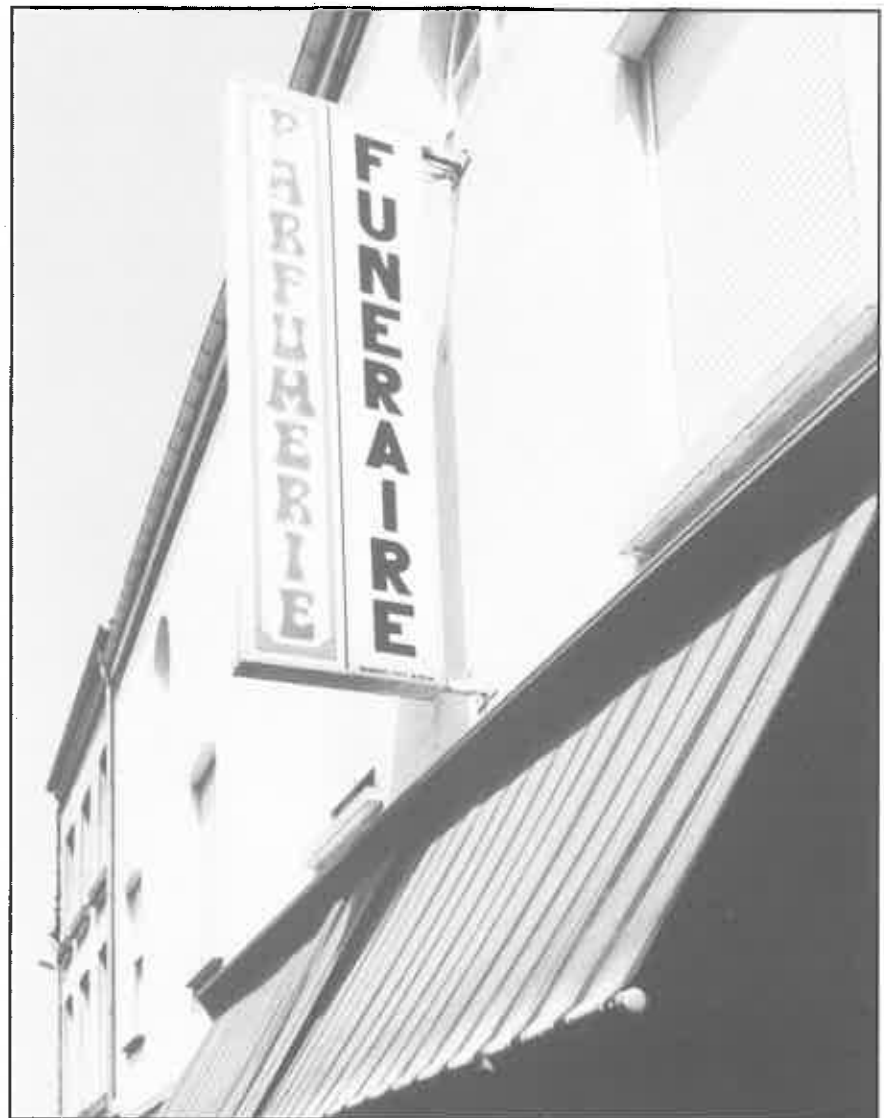
Bavay (Noord-Frankrijk). Zonder commentaar.

In de wandelgids is plaats ingeruimd voor een korte historische inleiding waarin de in de XVIIIe eeuw ingezette politiek tot het verplaatsen van de begraafplaatsen buiten de steden voor Nederland wordt uiteengezet en vervolgens de vrij late midden XIXe-eeuwse realisatie van deze optie in Amsterdam wordt toegelicht (Westerbegraafplaats 1860, Oosterbegraafplaats 1866). Het is jammer dat deze ontwikkeling van begraafplaatsen niet