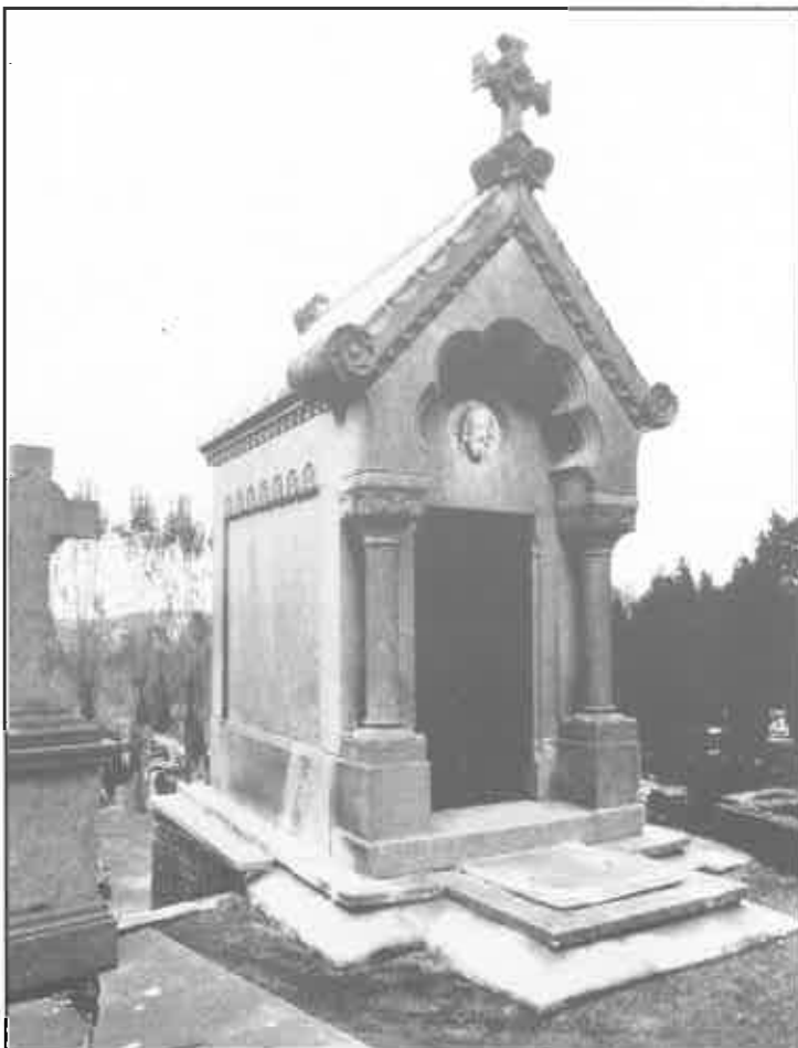
Sint-Amandsberg, Campo Santo, sectie B92. Grafkapel advocatenfamilie Schollaert, vermoedelijk opgericht rond 1856-57, ontworpen door architect Lodewijk De Curte, met steenhouwer Paternotte als uitvoerder en L. Elewaut als aannemer.

De aanleg van een begraafplaats op een heuvel is inderdaad vrij uniek in Vlaanderen en verleent aan de site een schilderachtig karakter. Nochtans is het Campo Santo te Sint-Amandsberg op gebied van aanleg geen specifiek campo santo. De term komt oorspronkelijk uit de