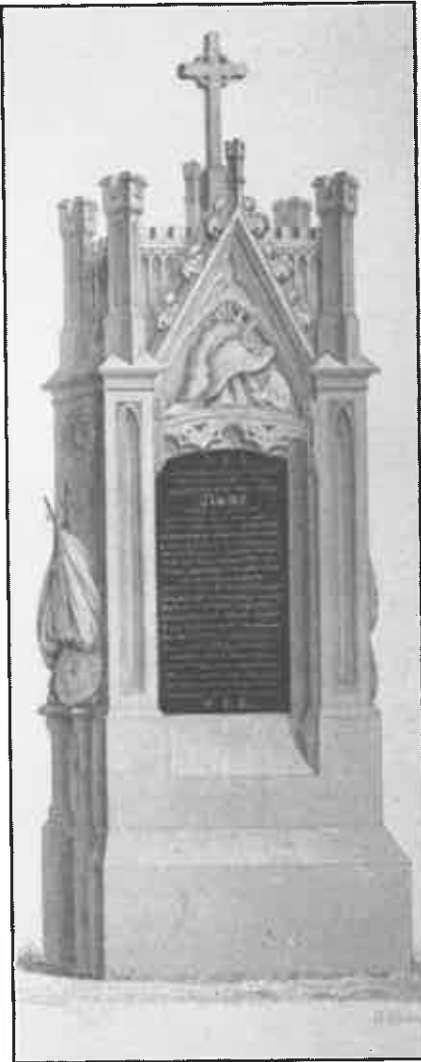
Sint-Amandsberg, Campo Santo.

Prijs : Leden 75 BEF / Niet-leden 150 BEF.