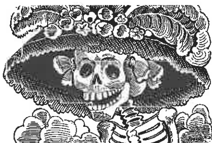
La Catrina, de Dood, is een personage ; het feest van de dood, een cultureel fenomeen in Mexico. (Europaliantentoonstelling, zie blz. 10)