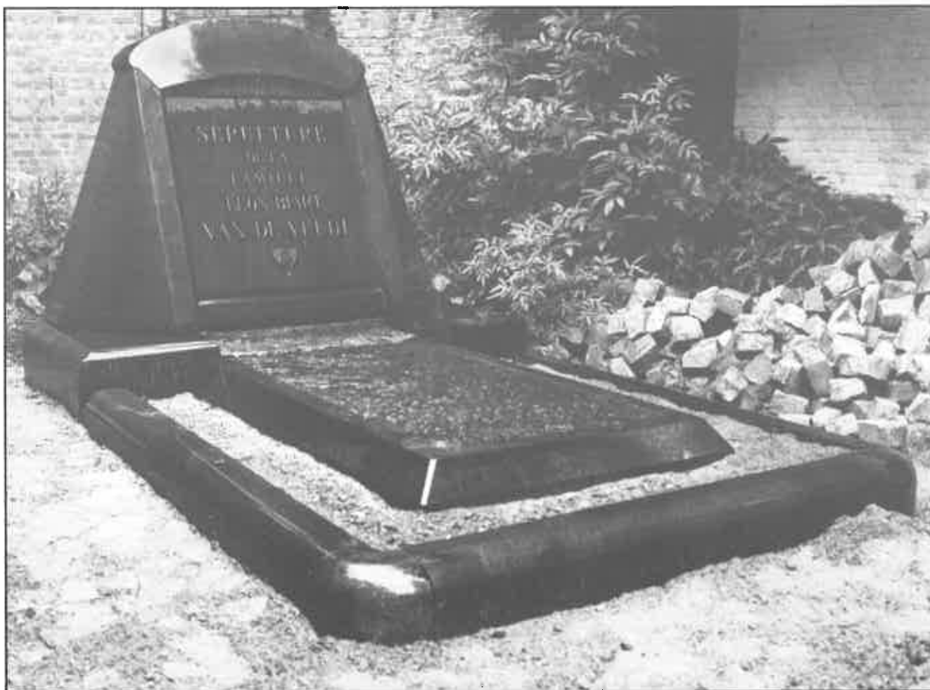
Henry Van de Velde, grafmonument Biart-Van de Velde, van 1907 tot 1936 op de Kielbegraafplaats te Antwerpen; thans één van de pronkstukken van Epitaaf in haar funeraire tuin te Laken.

Salomonis, des Hohen Liedes, der Apokalypse; daneben 'Gott und Staat' von Bakunin, die Einführung in das Leben Christi neben dem 'Kommunistischen Manifest' von Marx und Engels, das 'Tagebuch eines Revoltierten' von Kropotkin, Nietzsches 'Zarathustra' neben den 'Blümlein' des heiligen Franziskus und Dostojewskis 'Brüder Karamasoff'."