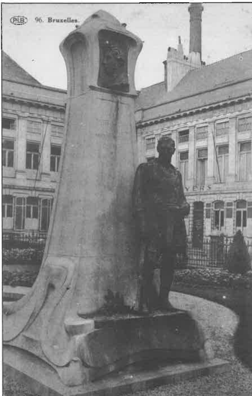
Henry Van de Velde, standbeeld van graaf Frédéric de Mérode, Martelaarsplein te Brussel. Postkaart P.I.B. vóór 1930 uitgegeven.