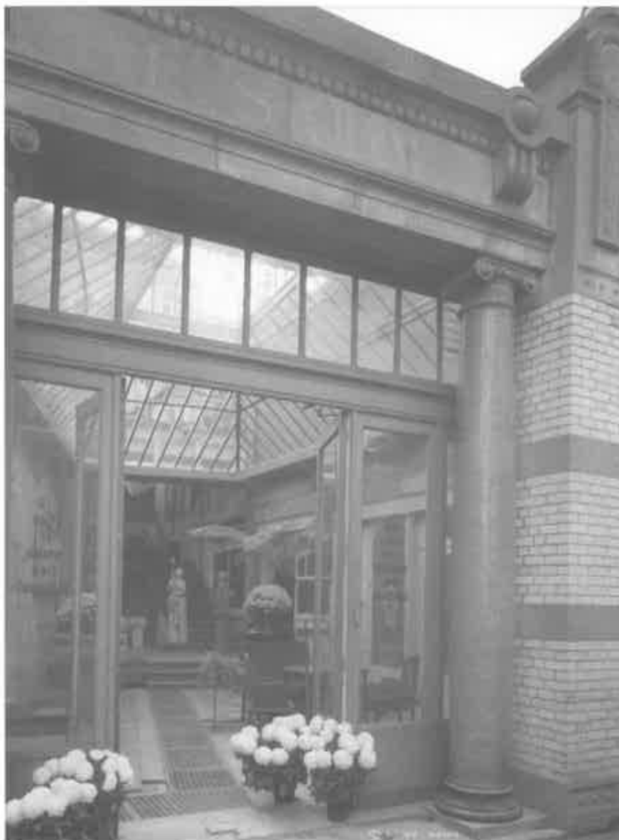
De wintertuin van de ateliers Salu te Laken met zijn nieuwe glazen koepel. Restauratie : Jos Vandenbreeden, architect.

Al meer dan 5 jaar wordt er gewerkt in de ateliers Salu. Dat een restauratie als deze slechts moeizaam vordert was te verwachten, het komt er nu eenmaal op aan om het authentieke karakter van deze zo unieke beeldhouwersateliers zoveel mogelijk te bewaren. Dat