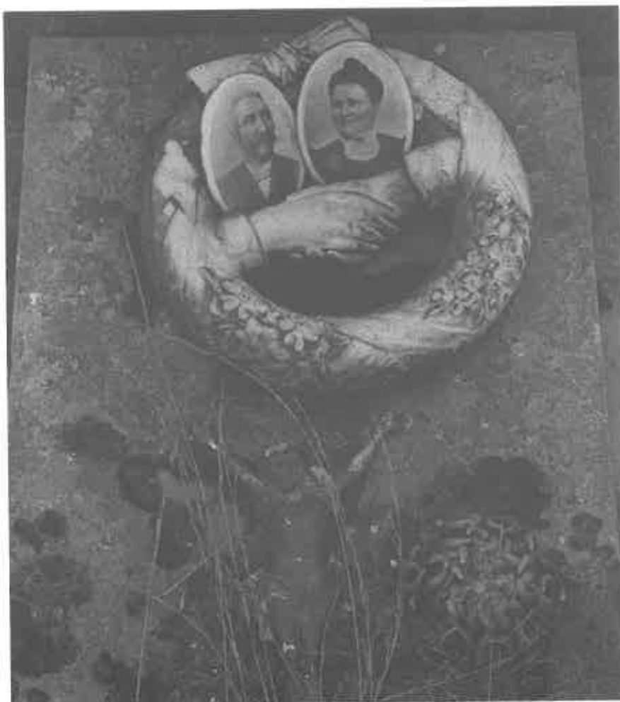
Onze-Lieve-Vrouwbegraafplaats van Borgerhout te Deurne (Silsburg).

Als men er nu nog toe komt om al onze meest merkwaardige begraafplaatsen en grafmonumenten ook te beschermen zitten we in de goede richting.