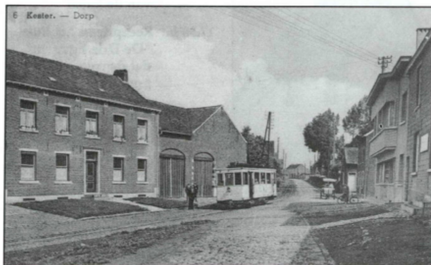
Een "boerentram" rijdt voorbij in Kester-dorp

Op 1 september van dit jaar was het tevens precies 25 jaar geleden dat de laatste tram naar Brussel reed. Tot in 1972 was Leerbeek een knooppunt van enkele tramlijnen dat het Pajottenland met onze hoofdstad verbond.