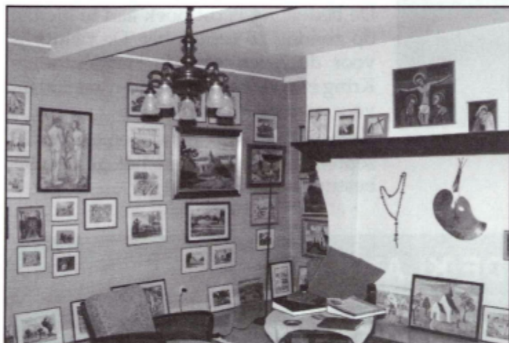
Het sfeervolle Marivoetatelier