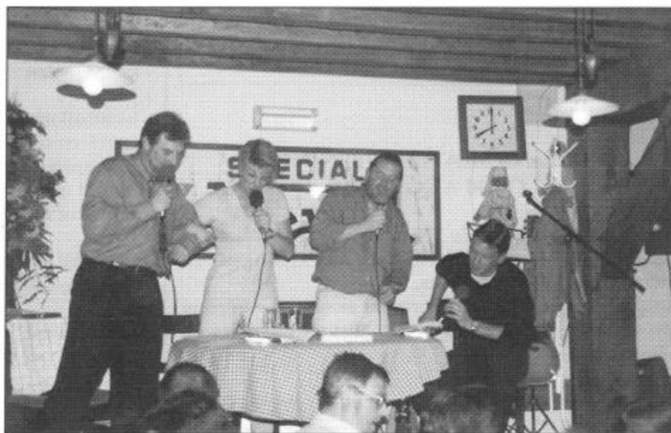
Het praatcafé van 24 april ...

Praatcafé "Amaai m'n Frak" blijft ook in 1998 een Gooiks topevenement. De edities van 25 september en van 27 november zijn inmiddels opnieuw uitverkocht.