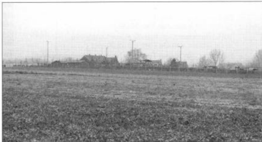
Hier komt de nieuwe sporthal...

Drie percelen grond, gelegen in de Processiestraat te Strijland, werden aangekocht voor de oprichting van deze sporthal. De bouw ervan werd toegewezen aan het Gemeentekrediet van België met leasingformule. Dit betekent dat het Gemeentekrediet zich zal bezighouden met de volledige uitvoering van het dossier, vanaf het opstellen van het contract met de ontwerper, het opvolgen van de plannen en de aanbestedingsprocedure tot en met de afwerking van de bouw van de sporthal. Zij staan dus in voor de financiering en de administratieve opvolging van het dossier in de rol van bouwheer.