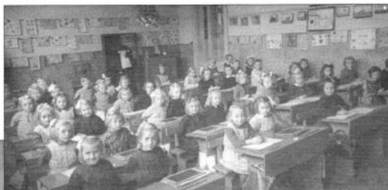
Zowat 50 jaar geleden

Wij houden U via Info-Gooik verder uitgebreid op de hoogte van de evolutie van het bouw dossier.