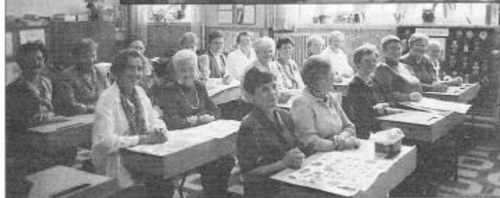
Zoals het nu is....