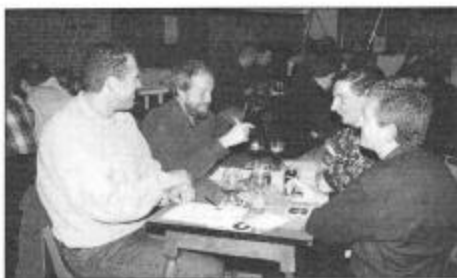
KWB Oetingen : de eerste Gooikse ploeg op de 4de plaats

Onder leiding van quizmaster Jos Huwaert kampen maar liefst 27 ploegen, waarvan de meerderheid van buiten Gooik kwam, op 13 november voor de eerste plaats in de tweede quiz van ActiHeem in zaal Edele Brabant te Strijland. Jos vuurde 10 reeksen van 10 vragen af die de grijze hersencellen van menig deelnemer danig op de proef stelden. "Kopie Kopie", de laureaat van vorig jaar uit Ninove, mocht zich opnieuw tot winnaar van de quiz kronen :