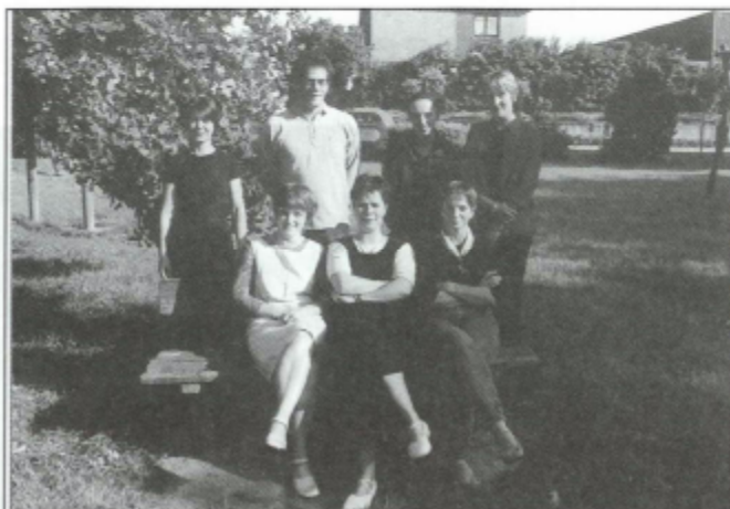
NB. Op deze foto ontbreekt Krista Straetmans die op 1 oktober 2001 als administratief bediende in dienst trad.