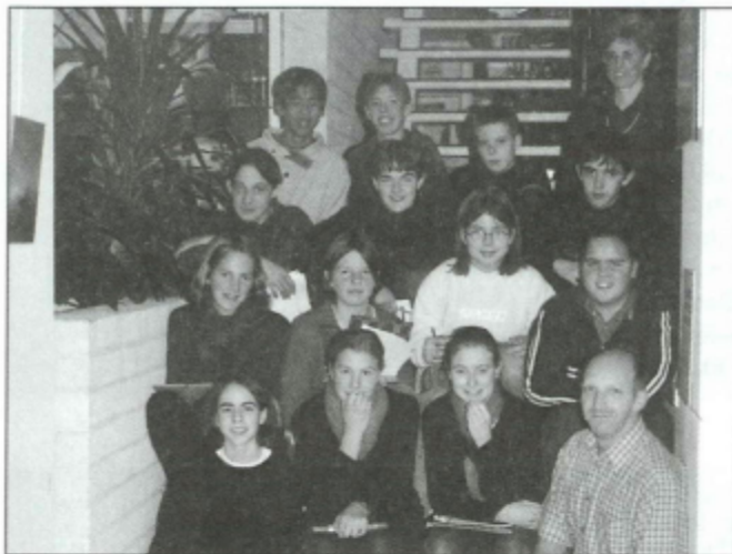
Een klas op bezoek in de bib ...