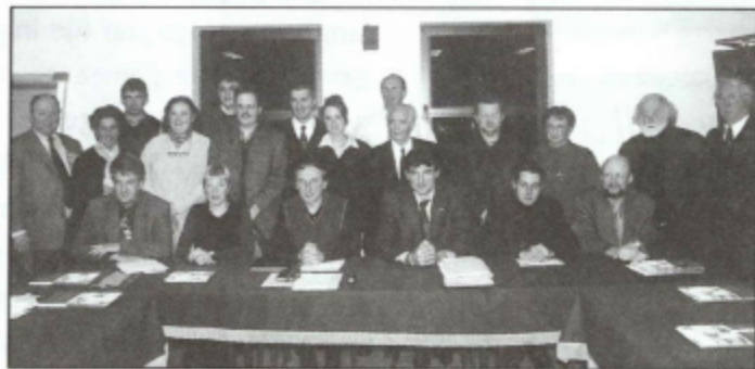
De adressen van alle raadsleden

Drukkerij ABC Halsesteenweg 40 9402 Meerbeke