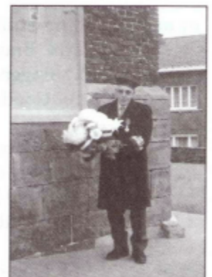
Marcel Lanneer van de Leerbeekse oud-strijdersbond brengt met een bloemstuk hulde aan het oorlogsmonument, symbolisch voor wat die dag ook in Gooik, Kester en Oetingen gebeurde.

Sinds de aanslagen van 11 september op de WTC-torens in New York doet de 11 novemberherdenking ons meer dan voorheen dieper nadenken over de relativiteit van de zeer broze vrede waar wij in ons rijke Westen denken in te leven. Het levenstrauma van al onze oud-strijders wordt meteen weer brandend actueel.