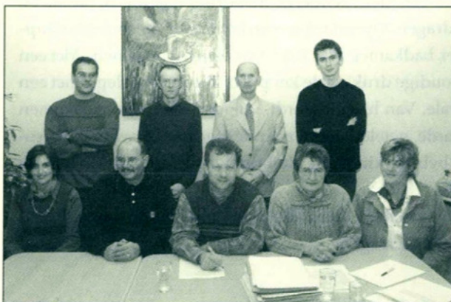
mevrouw Cindy Cammaert ontbreekt op de foto

Jo Baert (aanwezig op het OCMW: elke donderdag tussen 19.00 – 20.00 uur)