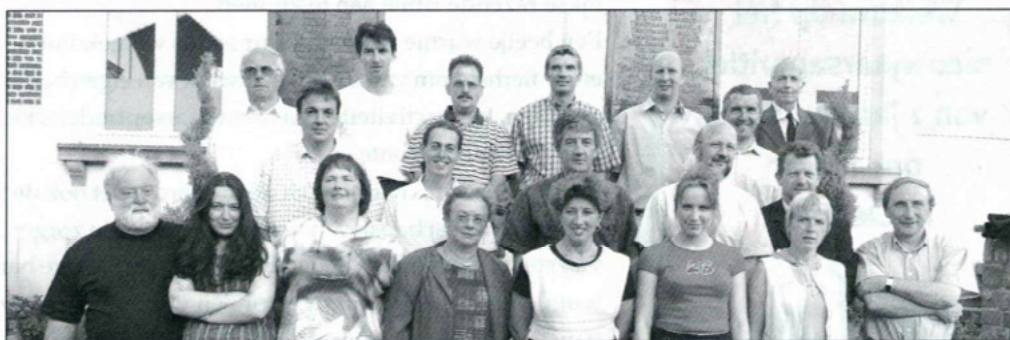
De adressen van alle raadsleden

Drukkerij ABC Halsesteenweg 40 9402 Meerbeke