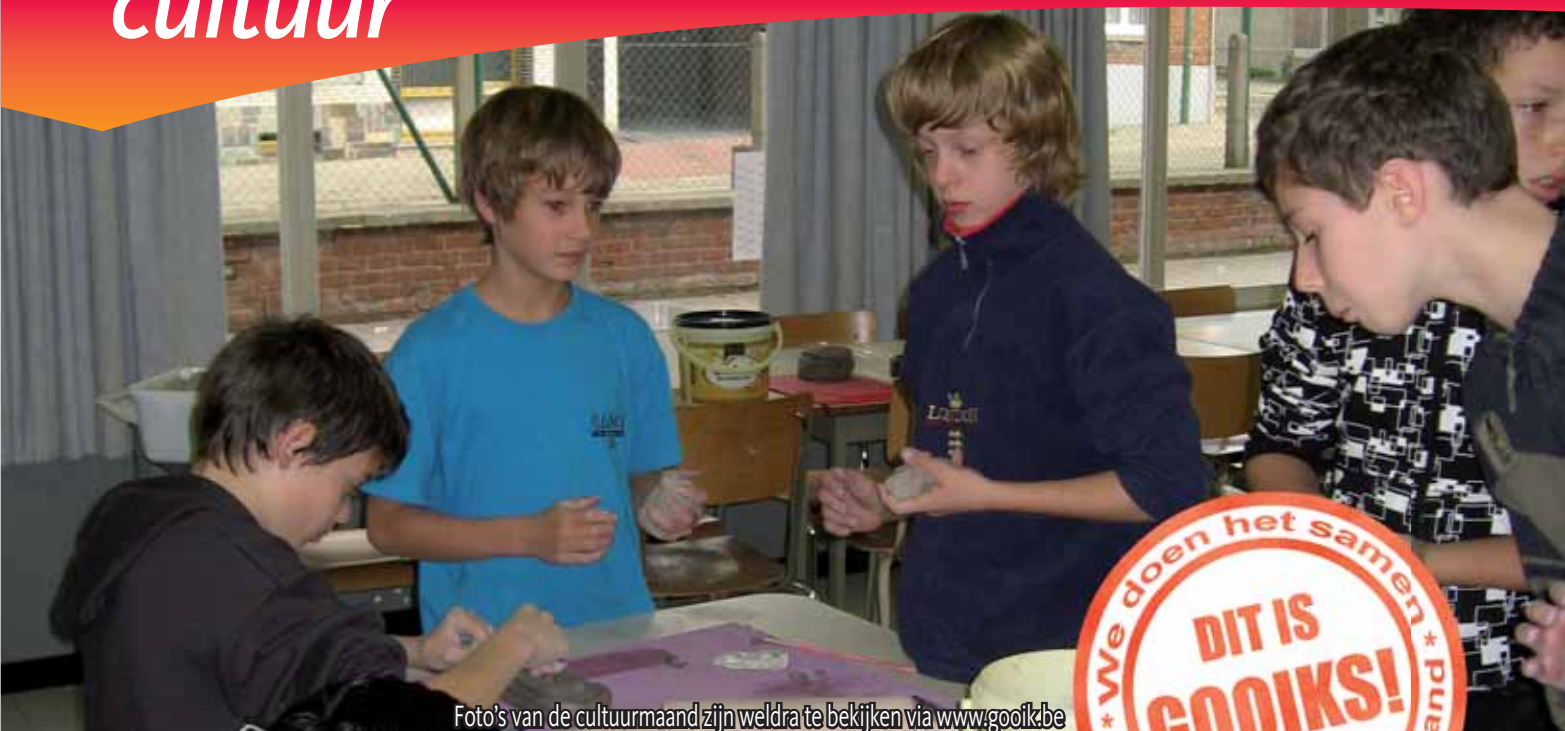
Foto's van de cultuurmaand zijn weldra te bekijken via www.gooik.be