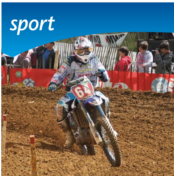
MX pics © Makke