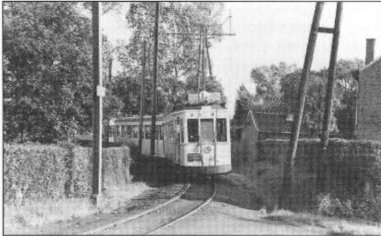
Nog een mooi beeld van een tram op de lijn Halle-Leerbeek, aan de achterkant van het station. Een onuitgegeven foto van 6 juli 1956 door Jacques Bazain. (Foto archief René De Loecker)

het boek op z'n tijd komt "want de generatie arbeiders en bedienden die aan de stelplaats van Leerbeek verbonden waren behoort zoetjesaan tot de groep van de hoge bejaarden."