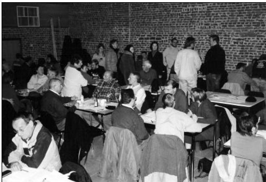
Foto van onze quiz van vorig jaar met de PAF-ploeg in het centrum.

i.v.m. hun opzoekingen. Hopelijk bezorgt een medegenealoog U de oplossing.