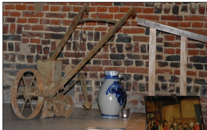
Een tweetal elementen om aan te tonen dat we de zaal wat in een Bruegeliaanse stemming hadden gebracht: een aantal vitrines met items rond Bruegel (koekendozen, boeken en strips) en wat oude werktuigen en schilderijen van de meester.