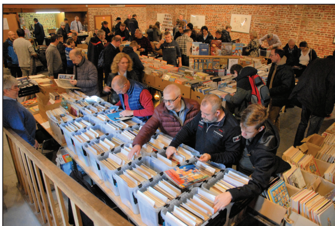
Een beeld van de drukte in de Schuur van de Cam tijdens deze stripbeurs: velen zijn intens bezig met het uitkiezen van hun favoriete strip.