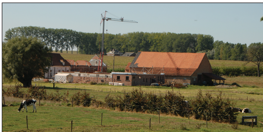
Twee beelden van het hof te Mergelingen: op de cover van het boek, zoals het er jarenlang heeft uitgezien en op de recente foto kan je de verbouwing en de vernieuwing duidelijk zien.