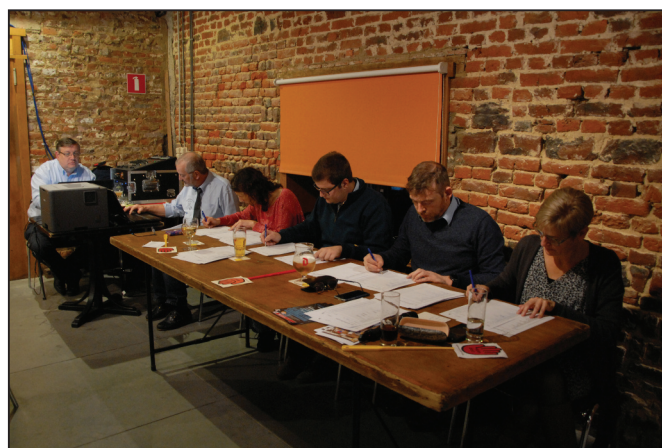
In een quiz komt het neer op concentratie, zowel voor de deelnemers als voor de jury en de 'helpers achter de bar of aan de computer.