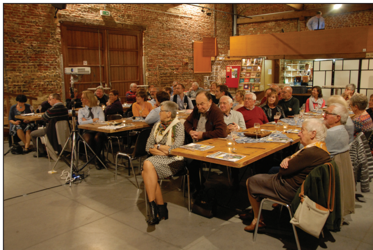
Een vijftigtal mensen zaten samen in de Schuur van de Cam en konden genieten van mooie (oude) films over het Pajottenland, een voordracht én lekker eten. Allemaal in het teken van Bruegel.