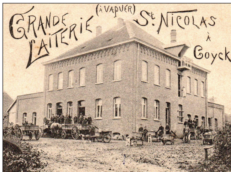
De oude melkerij in de Koekoekstraat in Gooik, nu een appartementsgebouw. Paarden én honden dienen als werkkrachten.