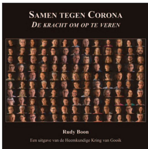
Het 'corona-boek', met de speciale kافت: 130 portretten van medewerk(st)ers bijeengebracht in één grote foto.

Wij vonden van wel, omdat het in ons leven altijd een blijvende herinnering zal zijn aan een – helaas – minder mooie tijd: de coronapandemie. Dit is een actualiteit, die binnenkort een stukje geschiedenis zal worden in het leven van iedereen. En daarom wilden we dat vastleggen in een boek, met foto's van al die mensen die geholpen hebben om ons leven weer wat 'normaal' te kunnen maken, foto's genomen door fotograaf Rudy Boon.