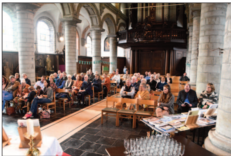
Veel belangstelling voor de presentatie van het boek in de mooie kerk.