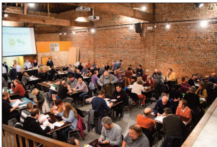
Een zicht op de Schuur met de 27 ploegen en de bar.

Het werd een heel toffe avond, die vrijdag de 5de november, ondanks de beperkingen ons opgelegd door de overheid: de mondkmaskers moesten aanblijven tot men neerzat. En onze medewerk(st)ers moesten die vervelende doekjes de hele avond dragen. Maar iedereen heeft dit perfect gedaan!