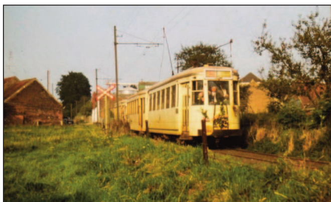
Een foto uit het boek, met de versierde tram, op de laatste dag van zijn rit van Brussel naar Leerbeek.

Wanneer het boek precies verschijnt, ligt nog niet vast. Er kunnen verschillende ‘kapstukken’ zijn waaraan we het kunnen hangen: volgend jaar ook bestaat het tram-museum in Schepdaal 60 jaar, er is het domein Paddenbroek waar sprake is van de komst van een tram, er is de Open Monumentendag, enz... Uiteraard willen we ook niet te lang wachten met het uitbrengen van het boek, vermits het zo goed als klaar is. Tijd brengt raad, en we houden jullie zeker op de hoogte van de verschijningsdatum van dit nieuwe boek in de ‘tramreeks’ van René De Loecker!