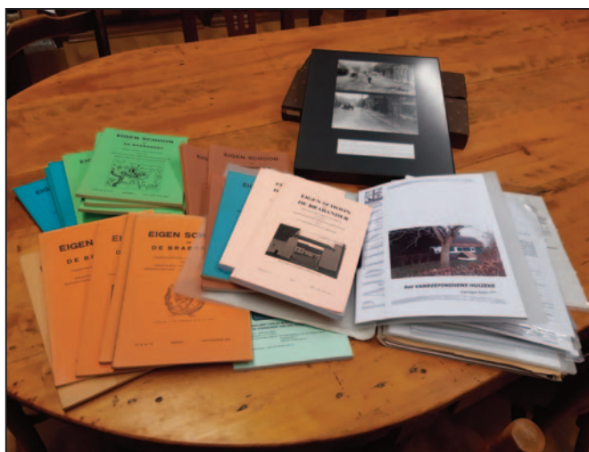
De giften van Anne Abeels.

Van Anne Abeels: nog één foto in kader, een aantal exemplaren nog van 'Eigen Schoon en de Brabander' en vooral een mooi aantal interessante documenten i.v.m. het Vanreepinghenhuizeke in Kester.