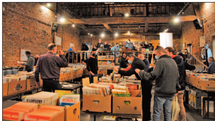
Zicht op de verkoop van de tweedehandsstrips onderaan in de Schuur.

Dit was wellicht een organisatie die op het nippertje kon georganiseerd worden! En gelukkig. We hadden er al een hele tijd naartoe gewerkt, deze 13de editie van onze intussen gekende stripbeurs. En het zou erg geweest zijn had die niet kunnen doorgaan. Maar het was toch nagelbijten tot het zo ver was en we groen licht kregen om de beurs te organiseren.