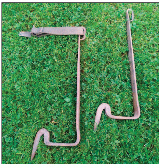
Het speciale werktuig...