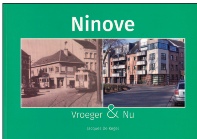
Cover van het fotoboek over 'Ninove, vroeger en nu', door Jacques De Kegel.