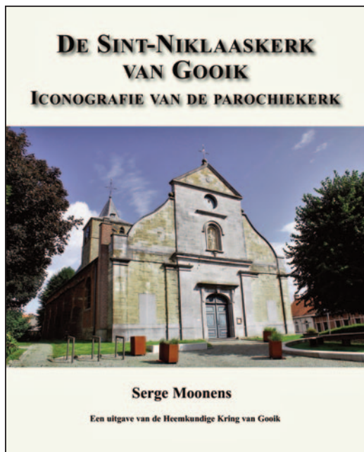
De cover van het fotoboek over de Sint-Niklaaskerk van Gooik.