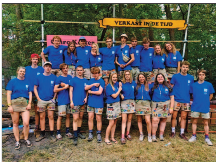
Een foto van de leiding tijdens het bivak in Langdorp in 2020.