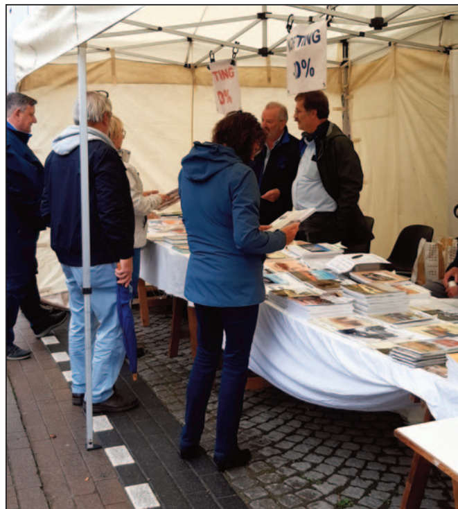
Een beeld van de jaarmarkt van vorig jaar: door het slechte weer hadden we echt niet druk met de verkoop, maar af en toe waren er toch geïnteresseerden aan onze stand.

Zoals de traditie het wil, zullen wij hier met onze Kring op aanwezig zijn met onze stand. We weten nog niet of we onze zelfde plaats zullen hebben, maar in ieder geval zal je ons wel vinden, via onze speciale banners.