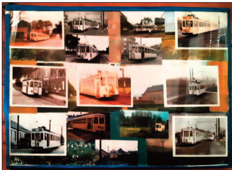
Paneel met foto's trams.

Op een morgen bracht Dirk Dermez dit speciaal paneel binnen op de Socio-culturele Dienst van Gooik. Hij wou dit schenken aan onze Kring, zomaar... Het is een soort collage van verschillende foto's van de boerentrams uit onze streek. Een mooi paneel dat we zeker kunnen gebruiken bij een (mogelijk) volgende tentoonstelling over onze trams.