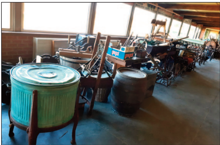
De toestand nu, de bedoeling is alle werktuigen te ordenen volgens het beroep. Nog heel wat werk dus, maar met hulp van onze vrijwilligers gaat dat wel lukken...