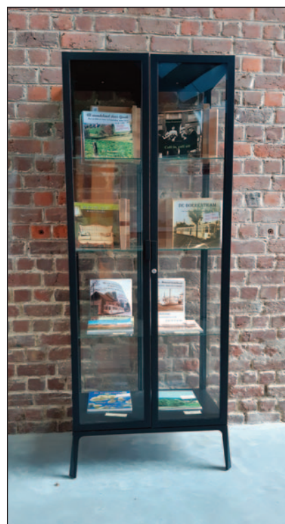
Onze kast met uitgaven, op een prominente plaats in Plattelandscentrum Paddenbroek.

Naast deze plaats kunnen onze uitgaven natuurlijk ook nog aangekocht worden in verschillende winkels in Gooik: De Knijf, Delhaize, Biowinkel in Oetingen, Horta in Kester, Adolphe Delhaize in Strijland, de bib en volkscafé De Cam. Ook in Lennik (De Backer en Standaard Boekhandel) en in Halle (Standaard Boekhandel) zijn onze boeken aanwezig.