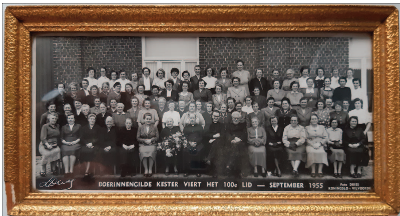
De bewuste kader met foto van de 100 KVLV-leden uit 1955.

Nu hebben we dus ook de/een originele kader in ons archief.