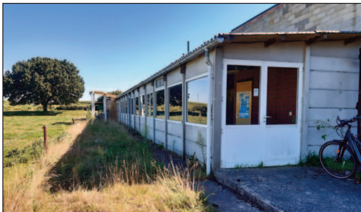
De vroegere kantine van VC Kester, die nu dienst doet als opslagplaats voor onze oude werktuigen.

Maar midden augustus II. werd er afgesproken onder de medewerk(st)ers om ook de kleinere werktuigen te verplaatsen naar Kester, zodat de verzameling weer één