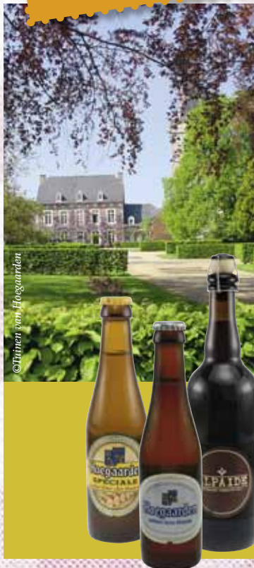
©Tuinen van Hoegaarden