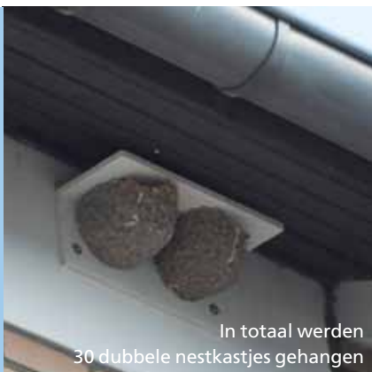
In totaal werden 30 dubbele nestkastjes gehangen

Beleidsverantwoordelijke: gedeputeerde Luc Robijns