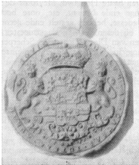
( ondertekend ) C. M. L. Princesse van Orange Per ordonnantie van sijne Hoogh. ( ondertekend ) De Back