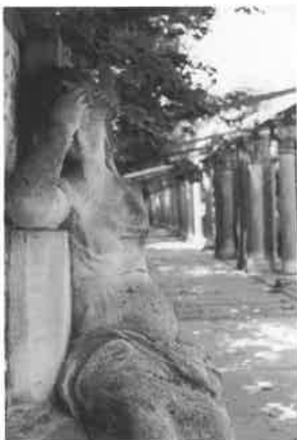
Treurende vrouw op de begraafplaats van Crooswijk.