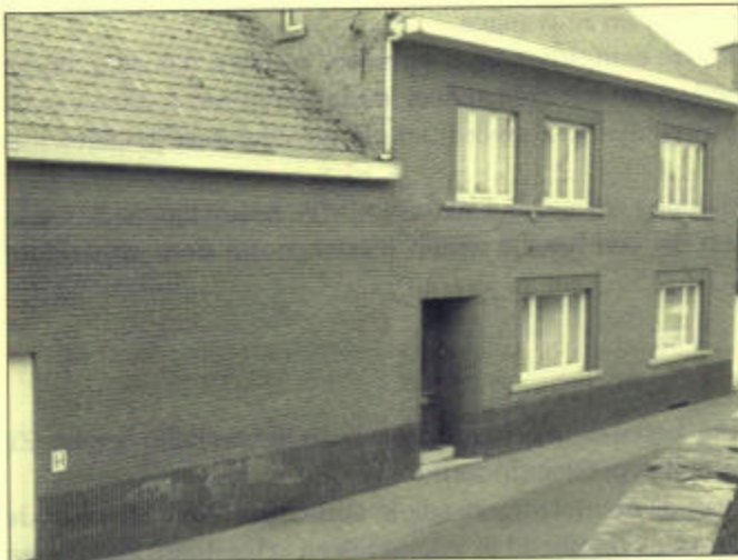
Voor beide projecten kunnen we rekenen op een staatstoelage van meer dan 60%.

In de Brusselstraat te Leerbeek hebben we recent een woning met schuur en bouwgrond aangekocht. Hier zullen eveneens 3 of 4 sociale appartementen worden in ondergebracht. Deze werken zullen de komende 2 jaar uitgevoerd worden.