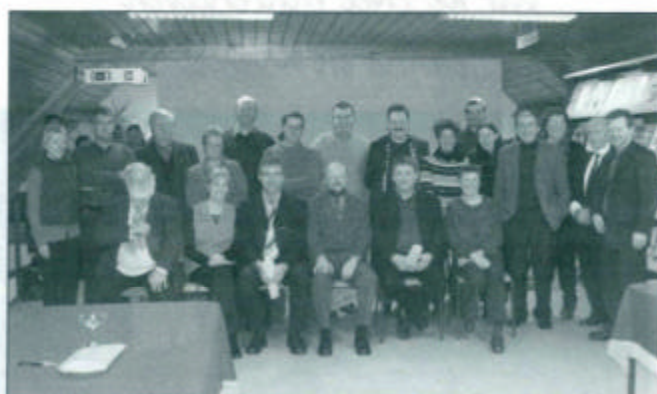
Van harte proficiat!