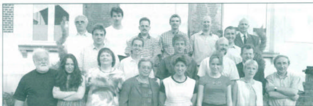
De adressen van alle raadsleden

Drukkerij ABC Halsesteenweg 40 9402 Meerbeke