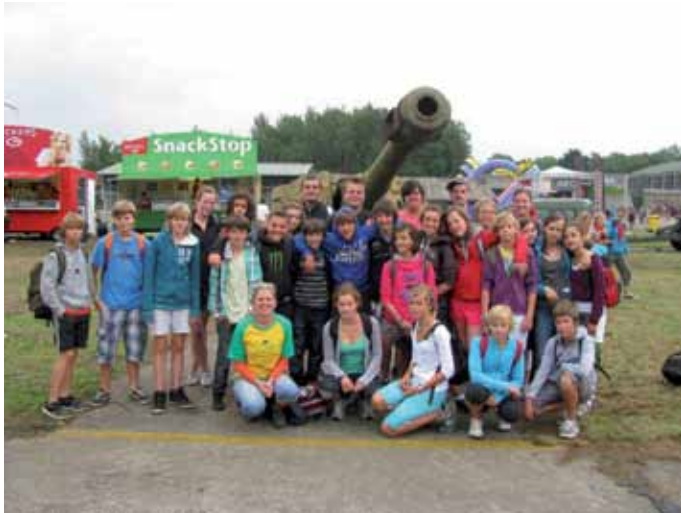
Zomer van de jeugd