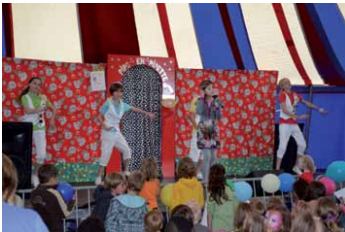
10 jaar speelpleinwerking