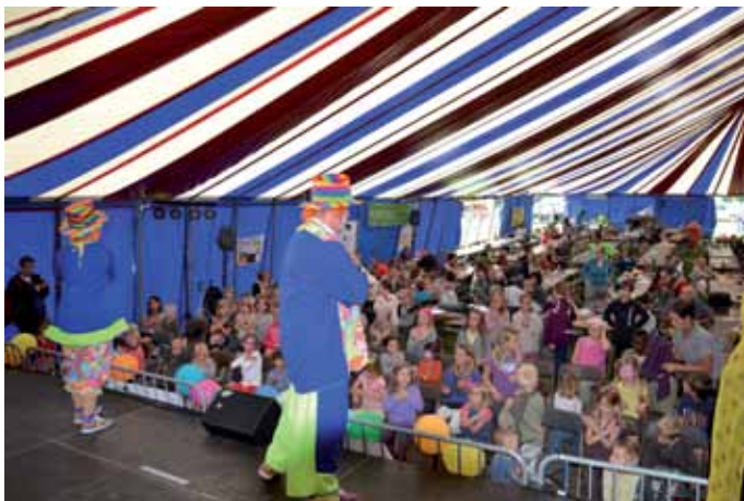
10 jaar speelpleinwerking