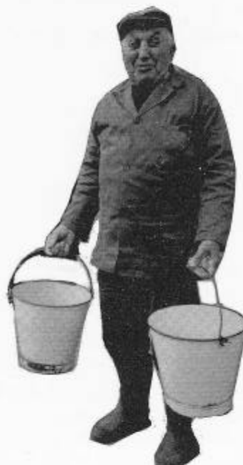
Bij de cover. Bella door fotograaf Yvan De Saedeleer (1993).

Kostprijs 500 Bef (voor leden), 550 Bef (voor niet-leden).