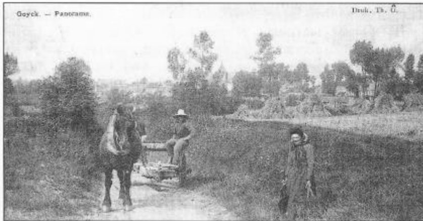
Eén van die prachtige oude foto's van Gooik uit de verzameling van de Kring.

bezitten: ofwel ze bij deze unieke verzameling te voegen, of toch tenminste een afdruk te bezorgen om het archief te vervolledigen.