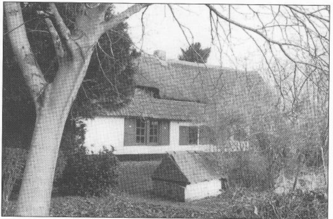
Het Van Reepinghens Huizeke te Kester