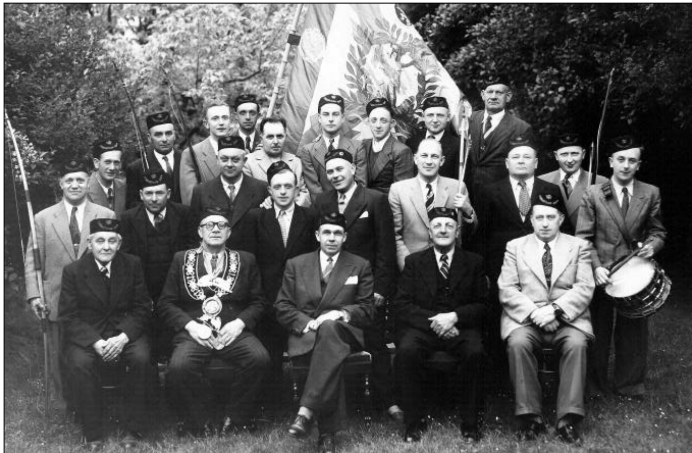
Foto van een groep van de schuttersgilde uit de jaren '50.