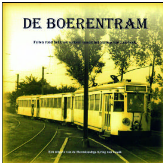
Afbeelding van de 2 kaften: De Boerentram en De Leerbeekse Buurttrams.

De prijs van het nieuwe boek bedraagt 18,00 € voor onze leden en 20,50 € voor de niet-leden. De DVD's, samengesteld door Tony Grant, zijn uitverkocht en worden enkel bijgemaakt als er nog een redelijke vraag naar is (prijs: 15,00 €).