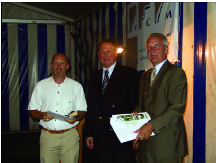
Foto met de uitreiking van de oorkonde aan onze Kring in aanwezigheid van minister Dirk Van Mechelen en voorzitter VCM Piet Jaspaert.

Uiteindelijk werden er 20 verenigingen geselecteerd nadat op 30 juni de inschrijfdatum verstreken was, waaronder onze eigen Heemkundige Kring van Gooik. Op dinsdag 7 september mochten wij een oorkonde in ontvangst nemen uit de handen van de heer Dirk Van Mechelen, Vlaams Minister van Financiën, Begroting en Ruimtelijke Ordening, in die laatste hoedanigheid bevoegd voor Monumenten, Landschappen en Archeologie.