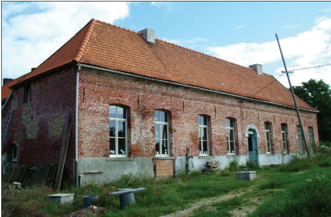
Beeld van de oude pastorie in de buurt van d'Aa Plosj te Oetingen.

denk eraan: deze zaken zijn altijd welkom bij ons. Al hetgeen interessant is wordt onmiddellijk ingescand en de bezitters krijgen zo goed als dadelijk hun objecten terug. Bellen en mailen kan naar de nummers en adressen vermeld in onze colofon. Hartelijk dank voor de moeite!