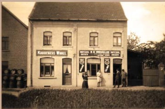
Een uitgave van de Heemkundige Kring van Gooik