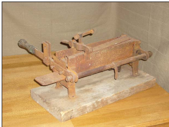
Het metalen tabaksnijtoestel.

De metalen koffiebrander heeft een hoogte van ruim 19 cm met een basis van 17 x 17 cm. De koffie wordt door middel van een opening in de trommel “gegoten” en wordt manueel draaiend aangedreven via een hendel. Het branden van de koffie gebeurde op een traditionele kachel.