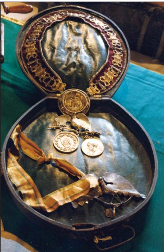
De brook van de Sint-Sebastiaans- gilde van Gooik.