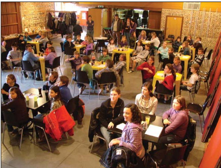
Een zicht op de schuur met een groot deel van de deelnemers. Rechts een beeld van de drie winnende ploegen.

(Vragen over algemene onderwerpen, maar het heemkundig aspect werd zeker niet vergeten: een tiental vragen handelen over Gooik!) Het werd een drukke bedoening voor de elf- en twaalfjarigen, waarbij ze telkens ook heel enthousiast reageerden toen bleek dat ze het juiste antwoord hadden gegeven.