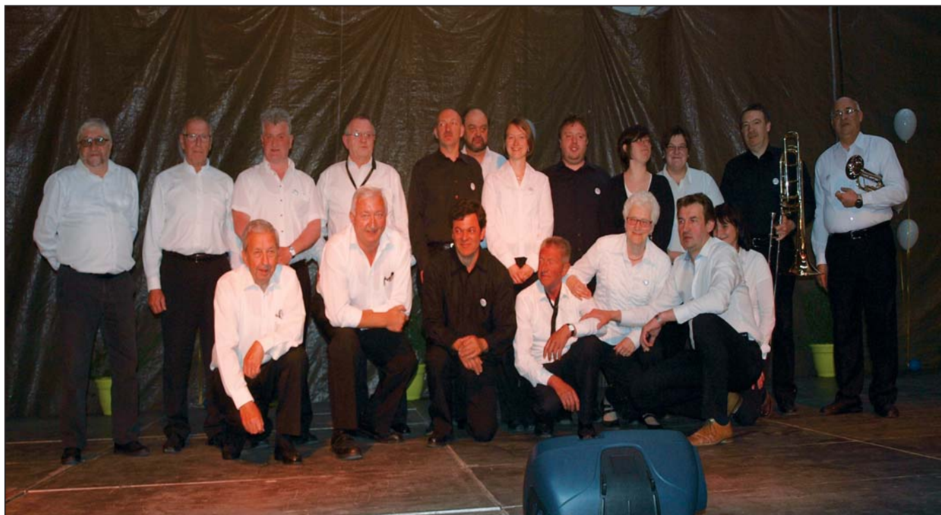
Bovenaan een groot deel van de leden van de Koninklijke Harmonie op het podium. Linksonder de danseressen van De Crescendo's uit Leerbeek. Rechtsonder de jongens van The Black Hammers Drum Corps.