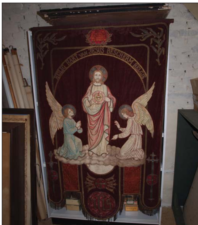
De vlag van de oudstrijders van Strijland in ons archief.