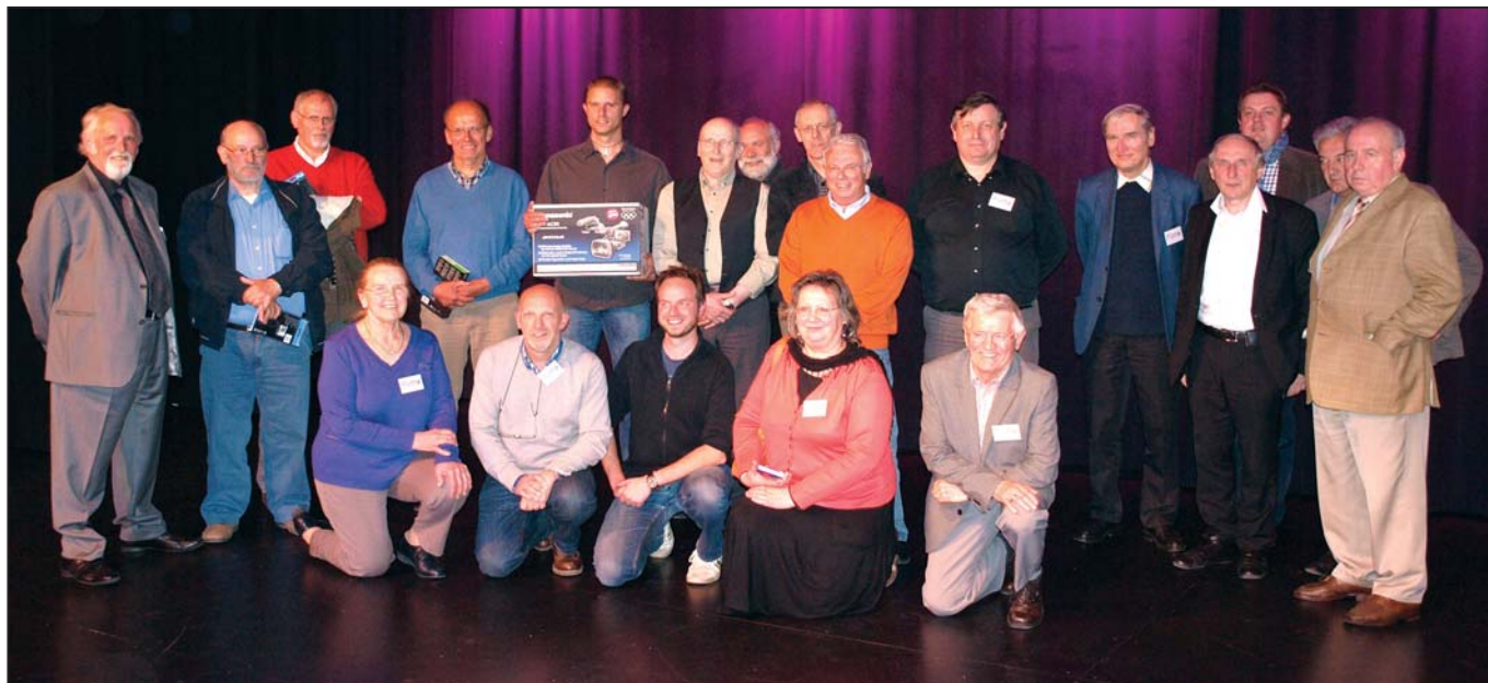
De organisatoren, de juryleden, enkele burgemeesters en schepenen en enkele winnaars, samen op de groepsfoto op het einde van de dag.