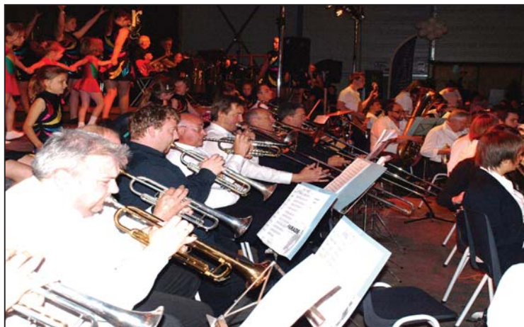
De mannen en vrouwen van de Koninklijke Harmonie in volle actie tijdens hun groot feest in de loods in Strijland.

terende muziek, gebracht door enthousiaste muzikanten. Misschien één ding spijtig: achteraan was de klank niet altijd goed te horen, waardoor de muziek wat verloren ging in de grote ruimte. Een klein foutje, maar dat weegt natuurlijk niet op tegen al dat mooie dat te zien en te horen was, die avond.