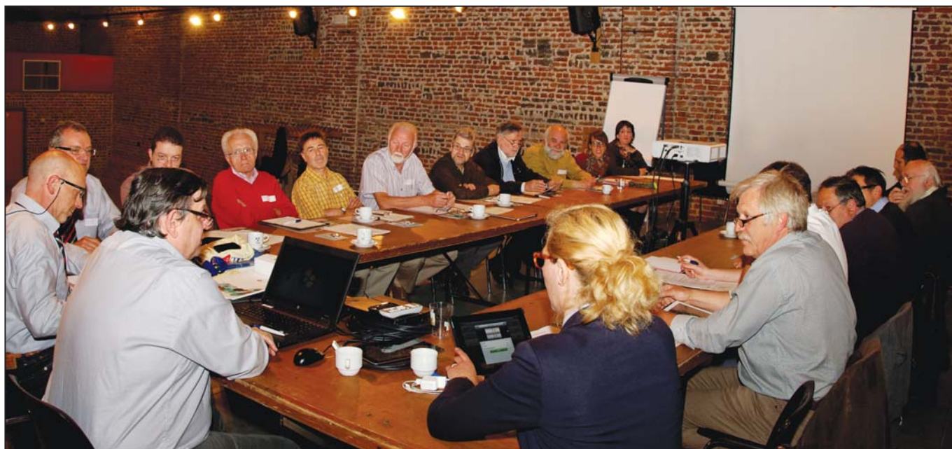
Beeld van de deelnemers en deelnemers op het heemkringenoverleg in de Schuur van De Cam. Onze Kring en de erfgoedcel PZ waren de gastheren voor de eerste gezamenlijke werkvergadering.