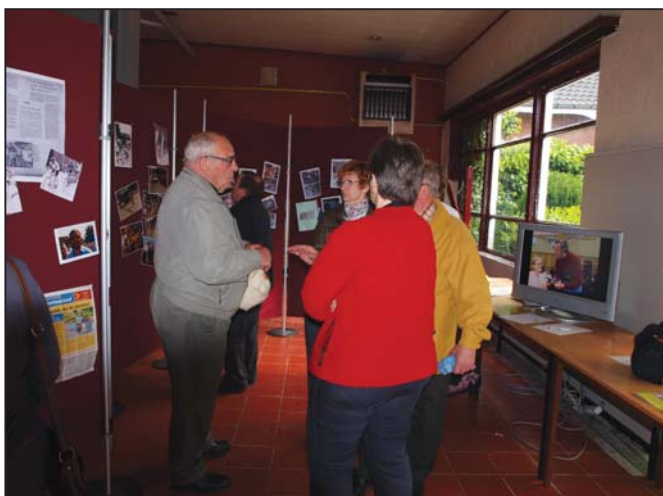
Bezoekers aan de tentoonstelling ter gelegenheid van de 50 ste Grote Prijs halen herinneringen op aan vroeger.

De Kesterse Wielervrienden (die hun 8 ste grote prijs organiseerden) hadden voor de gelegenheid een mooie tentoonstelling opgezet in de zaal Jagershof te Kester zelf, die open was gedurende het hele weekend. Daar waren een groot aantal prachtige oude foto's te bewonderen, uit de jaren 1960-1970 tot en met nu. Het was