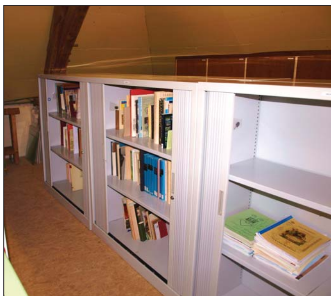
Ons archief met de nieuwe kasten, waarin reeds een heleboel boeken en documenten zijn te vinden.

We waren al een tweetal keer samengekomen met een aantal vrijwilligers, om wat orde te brengen in ons