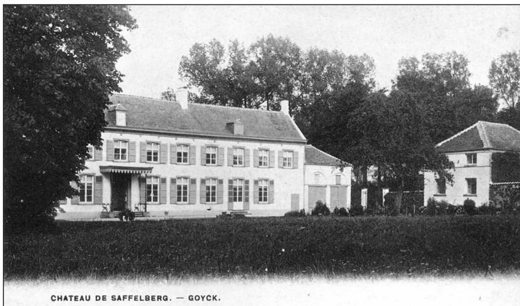
Het oude landhuis (kasteel) van Saffelberg (eind 19 de - begin 20 ste eeuw) waar de familie de Wouters de Bouchout woonde. Later kwam hier het huidige kasteel met de familie van Oldeneel tot Oldenzeel.

Voor een mogelijke voorstelling van het boek wordt de periode december 2013 naar voor geschoven. De correcte datum vermelden we beslist in ons volgend nummer.