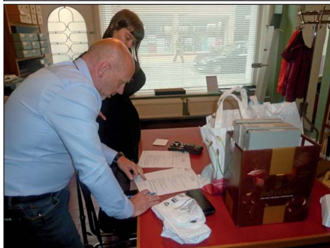
Het nodige papierwerk wordt in orde gebracht, waarna we onze oude films achterlieten in Studio Alijn te Gent.