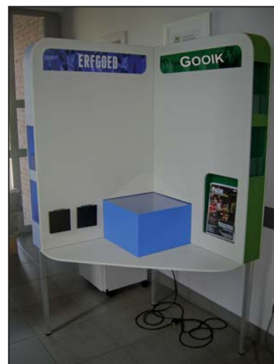
De Gooikse erfgoedkast.

Een jaar later deden we een oproep om oude (erfgoed)films bij ons binnen te brengen, om ze alsnog te digitaliseren. Samen met de erfgoedcel Pajottenland en Zennevallei trokken we op 28 mei naar Studio Alijn in het Huis van Alijn te Gent. Wij konden hen een 30-tal