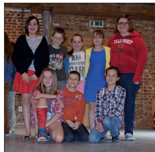
Links de winnaars 'De Slimme Ezels' uit Gooik, in het midden op de tweede plaats 'De Strijlandse Doordenkers Quiz-kids' en rechts op de derde plaats de Oetingense ploegen 'De Chmieggels' en 'De Stars'.