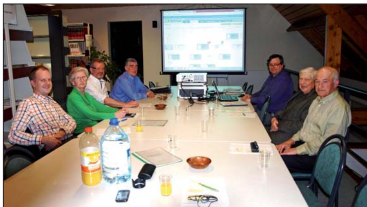
Enkele van de geïnteresseerden voor de uitleg over onze centrale familiedatabank GeneaGooik.

Op woensdag 26 maart gaf onze medewerker Johnny Van Bavegem een voordracht i.v.m. de werking van het opstellen van je eigen stamboom. D.m.v. een duidelijke uitleg konden de 10 geïnteresseerden goed volgen hoe ze in de toekomst een eigen stamboom in mekaar kunnen steken. Via MyHeritage (een algemeen programma) tot ons eigen GeneaGooik (een eigen programma): de verschillende stappen werden zichtbaar uitgelegd via een projectie op groot scherm en via praktische voorbeelden.