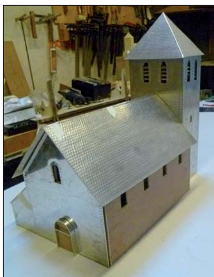
De maquette van de kerk van Gooik, bijna afgewerkt.