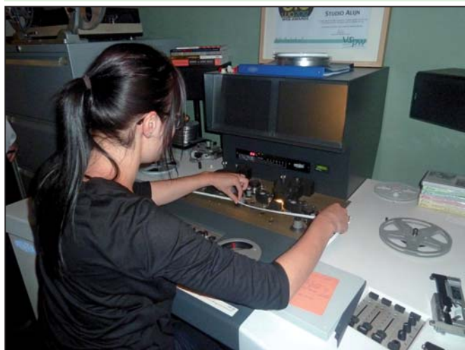
Een medewerkster van Studio Alijn plaatst één van onze oude films op de professionele projector, om de kwaliteit van deze film te kunnen inschatten.

oude films overhandigen, die op een professionele manier zullen worden gedigitaliseerd.