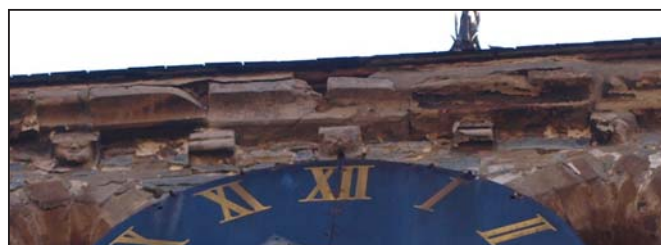
Een beeld van die middeleeuwse ‘kopjes’, net boven de horloge van de kerk.

Enkele weken terug ontdekte Dierik Potvlieghe enkele unieke sculpturen op de 13 de eeuwse toren van de Gooikse Sint-Niklaaskerk. Aan de noordzijde, onder de dakrand, verwerkt in de kroonlijst, kunnen we duidelijk enkele middeleeuwse gezichten herkennen. Het zijn Gooikse getuigen die al 700 jaar lang hun blik richten op ‘t Hoeike, waar sinds de tweede helft van de vorige eeuw onze geliefden worden begraven. Niemand heeft hun aanwezigheid opgemerkt, maar ze zijn er altijd geweest, wakend over de ‘Patjesschool’ (kleuterschool) die naast de kerk lag. Aan de andere zijden van de toren moeten ongetwijfeld gelijkaardige middeleeuwse gezichten hebben geprikt, maar de tand des tijds heeft hun blik vervaagd. Welke voorvaderen hebben hier model gestaan? Wie is de schepper van deze wachters geweest? Hopelijk wordt onze toren gauw gerestaureerd, zodat dit unieke middeleeuwse erfgoed voor ons nageslacht kan worden bewaard. (Tim Juwet)