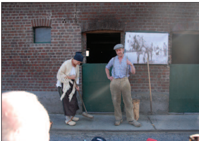
Toneelacteurs spelen stukjes met echte verhalen uit Geluwe in WO I.

De ontvangst van de bezoekers uit Gooik door de Wervikenaars was telkens ongelooflijk vriendelijk en gastvrij. Men voelt dat een soort 'verbroedering' in de lucht hangt en dat zou maar goed zijn ook voor twee