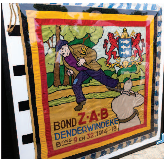
De vlag van de Bond Z.A.B. van Denderwindeke. (Z.A.B. betekent 'Zivil Arbeiter Bataillon').