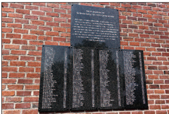
De gedenkplaat, met de namen van de 171 weggevoerden van Denderwindeke.

Op zondag 24 juni 2018 werd in onze buurgemeente Denderwindeke een gedenkplaat ingehuldigd voor de 171 mannen die tijdens 'de Grote Oorlog' werden weggevoerd uit het dorp, naar Noord-Frankrijk. Zij moesten daar voor de Duitsers infrastructuurwerken uitvoeren, zodat deze hun oorlogsmateriaal en troepen vlot naar het front konden verplaatsen. 10 mensen van de 171 zijn