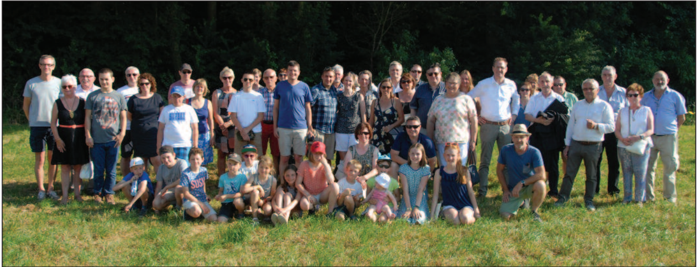
De voltallige groep Gooikenaars die naar Geluwe trokken op 30 juni 2018.

Die film maakte deel uit van een evenement op zaterdag 30 juni van dit jaar, waar hij o.a. werd vertoond aan een groep Gooikenaars en vele Geluwenaars. Het werd toen een programma van een halve dag met een busuitstap van een 30-tal Gooikenaars, met o.a. een rondleiding door Wervik, meemaken van mooie, maar aangrijpende toneeltjes (i.v.m. de oorlog en vluchtelingen) en een speciaal optreden van Michel Doomst, burgemeester, die fungeerde als Gooikse priester die de 'opname' van de Geluwenaars in zijn dorp meemaakt. Knap hoe dit naar voor werd gebracht.