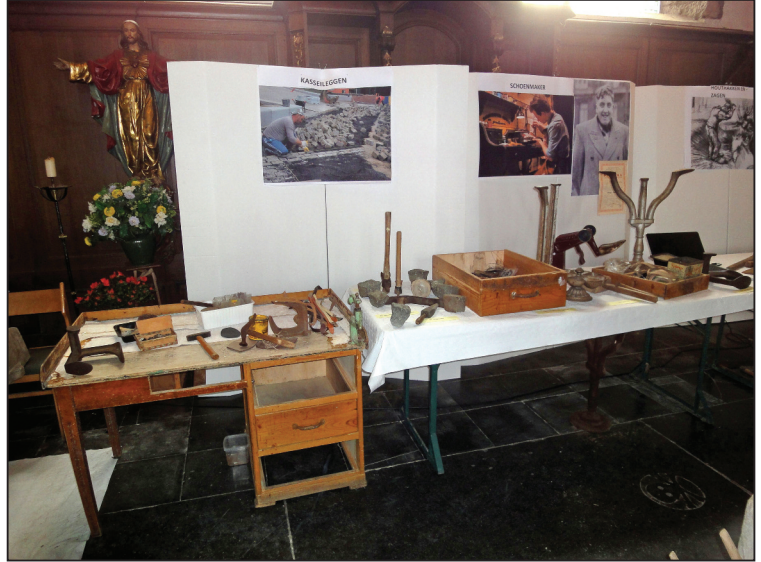
De verschillende beroepen hebben elk hun eigen stand gekregen met de betrokken werktuigen, zo wordt het overzichtelijk. Hier zie je o.a. die van de bakker, de kasseilegger en de schoenmaker.