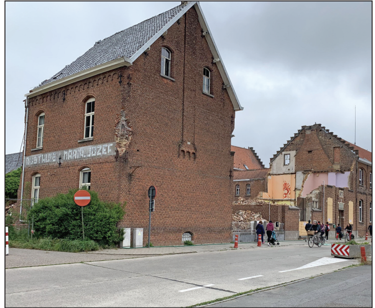
Het zicht op het deels afgebroken klooster van Oetingen.