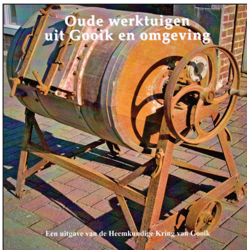
Cover van onze nieuwste uitgave 'Oude werktuigen uit Gooik en omgeving'.

Waar de voorwerpen huizen na de tentoonstelling? Dat kom je te weten in een aparte bijdrage... Het boek 'Oude werktuigen uit Gooik en omgeving' is uiteraard nog te koop in de klassieke verkooppunten in Gooik, Lennik en Halle. Het kost 12,50 euro voor leden en 15 euro voor niet-leden. Een aanrader!