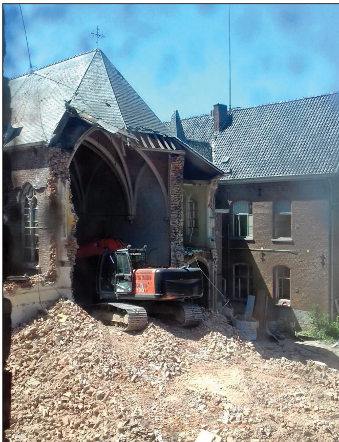
Het begin van de afbraak van de kapel.