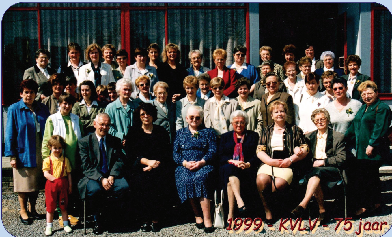
1999 - KVLV - 75 jaar