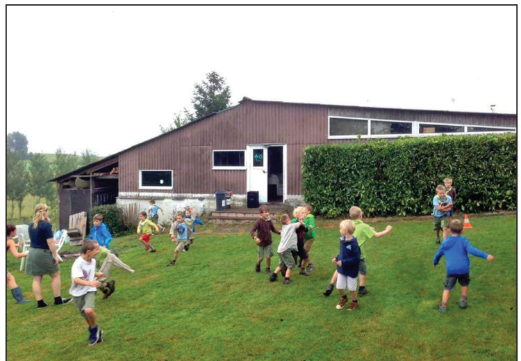
De zijkant van het scoutslokaal op de Cley.

Wens je op de hoogte te worden gehouden van al onze activiteiten die georganiseerd worden ter gelegenheid van het 75 jaar Scouts Gooik-feestjaar? Surf dan zeker eens naar onze webstek https://www.decley.be . Hier vind je al onze activiteiten terug en vind je onderaan de