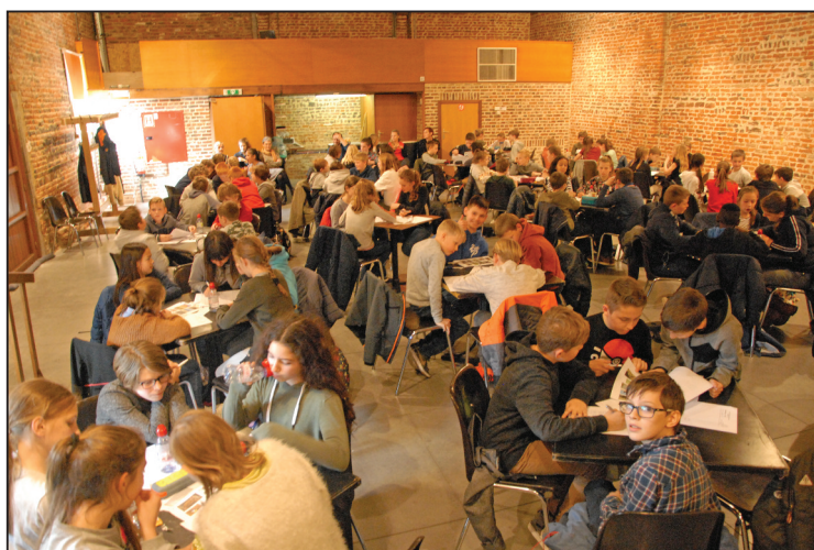
Een zicht op de goedgevulde Schuur, met 87 enthousiaste leerlingen uit het Gooikse, tijdens de 15de scholenquiz.