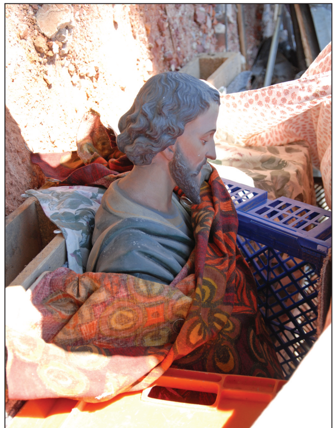
Eén van de beelden uit de kapel die nog behouden is.