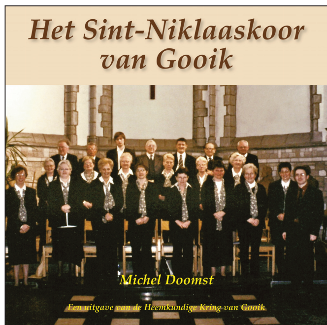
Cover van het 56ste boek van onze Kring 'Het Sint-Niklaaskoor van Gooik'.

Uitgerekend op 'moederdag' werd in de benedenzaal van Familia het 56ste boek van onze Heemkundige Kring voorgesteld: 'Het Sint-Niklaaskoor van Gooik'.