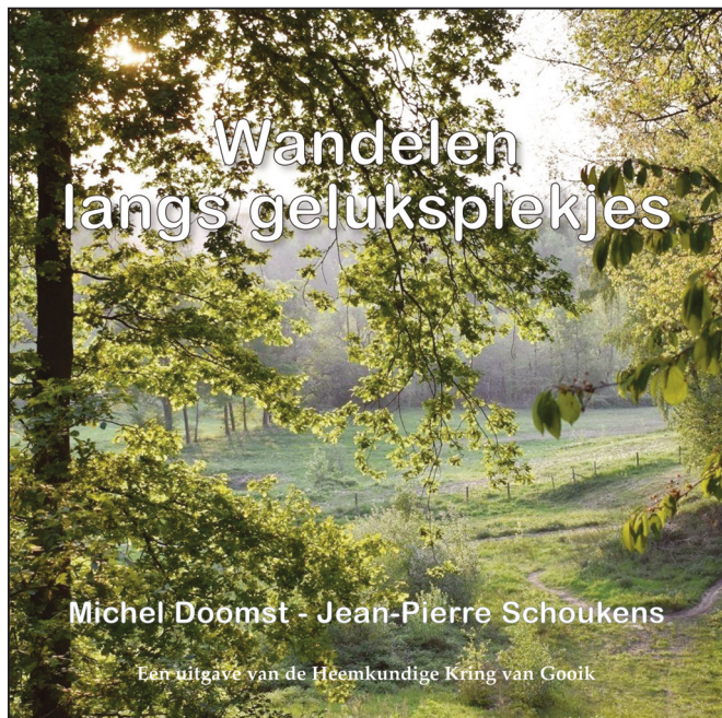
Cover van het 57ste boek "Wandelen langs geluksplekjes".

Op één van die weinige dagen in de laatste maanden, dat de zon scheen, stelden we dit 57ste boek in de reeks 'Bijdragen tot de Gooikse geschiedenis' voor, met name