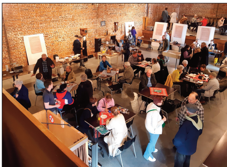
Een zicht op de Schuur van de Cam, met in het midden de ‘proevers’ en op de kant de ‘leveranciers’ van het eten, volgens een oud recept.

Zo ver wilden wij in onze Kring niet gaan, we kozen voor een leuke invulling van het thema, door de nadruk te leggen op oude gerechten, die onze grootmoeders maakten, en die dan uit te werken. Ik denk aan ‘plat spécial’, ‘oortjes en pootjes’, tomatensoep met balletjes, pudding gemaakt met echte koeienmelk, wafels, rijst-pap, enz. Dat hebben we dan ook klaargemaakt die zondag, met z’n allen, in de Schuur van de Cam. Het verslag van die dag kan je verderop lezen in dit tijdschrift.