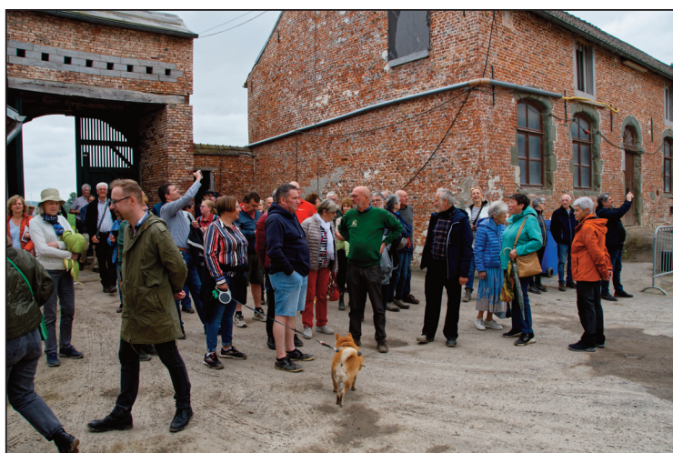
Drie beelden van de wandelaars in Leerbeek: eerste halte was in de kapel van de Stevenisten, ergens tussendoor met uitleg van iemand van de Landelijke Gilde van Gooik en de laatste tussenstop was op de binnenkoer van het Hof Bree-Eik.