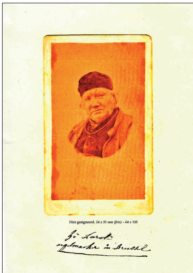
Een voorlopige cover van het boek over Hippolyte Loret, opgemaakt door auteur Ghislain Potvlieghe.

Ongeveer vier jaar is Ghislain Potvlieghe intussen bezig geweest aan een heel uitgebreid werk over Hippolyte Loret, de orgelbouwer die o.a. het orgel uit de Sint-Niklaaskerk van Gooik heeft ontworpen. En ook dit werk nadert stilaan zijn eindpunt. Het zal uit 2 delen bestaan, want het zal niet alleen over Hippolyte gaan, maar ook over zijn vader en broers, die ook orgelbouwers waren.