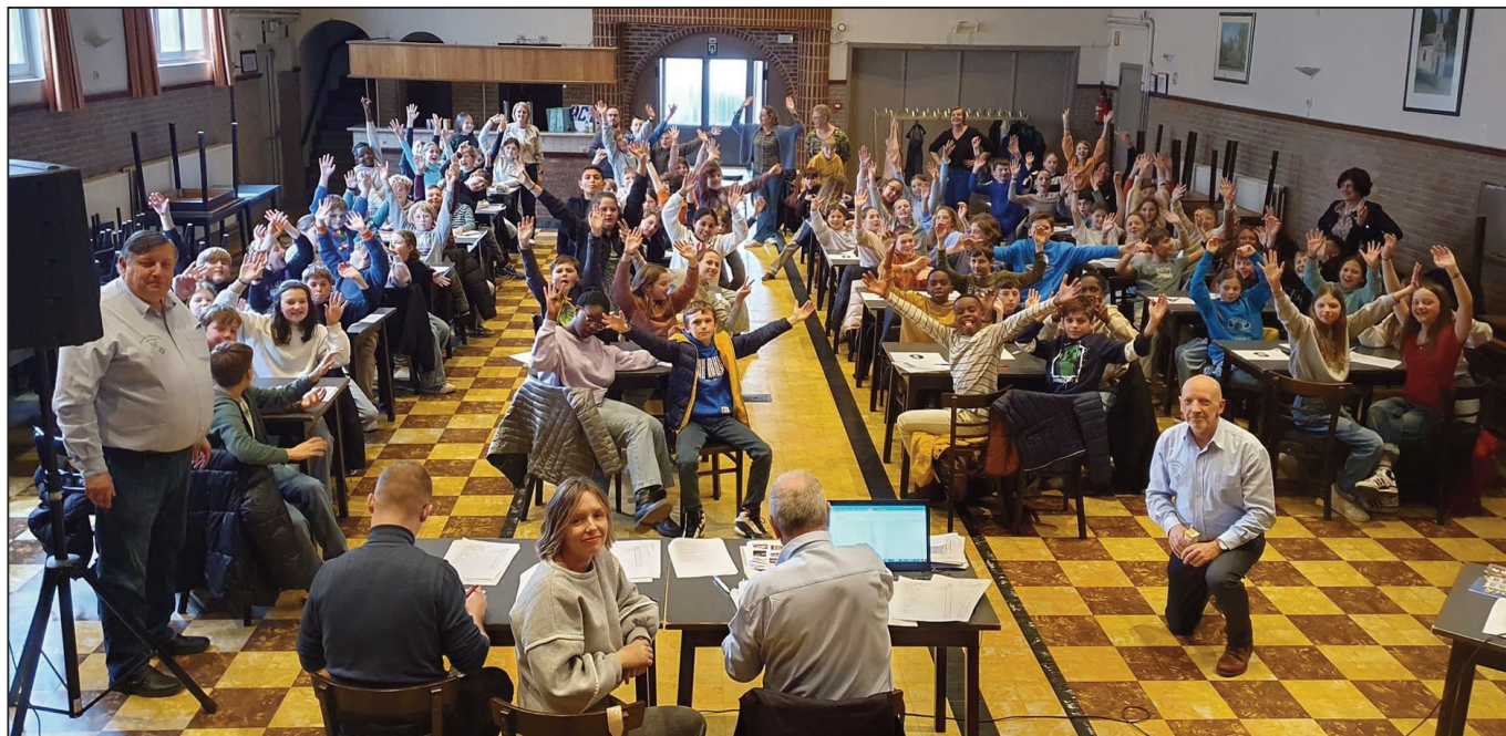
Een overzicht van de 91 deelnemers, de juffrouwen, de meester, de directrices en de medewerkers van de Heemkundige Kring van Gooik.