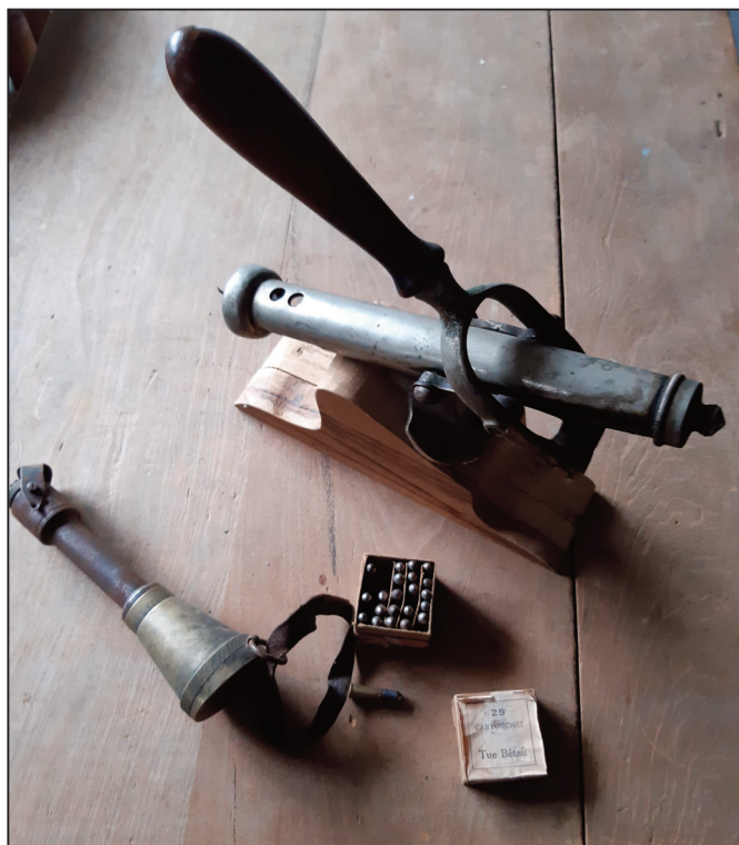
Een detailfoto met het varkenspistool en de ontstopper.