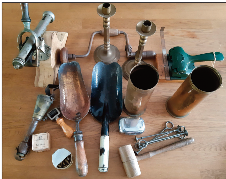
Een mooie verzameling van oude werktuigen, met een speciale geschiedenis.