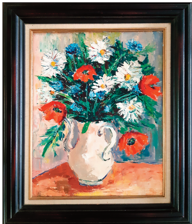
Een stilleven van 'meester' Maurice Dooms.