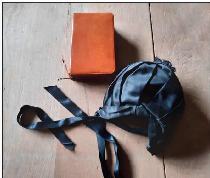
Een oud kerkmissaal en een vrouwenhoedje.

Later studeerde hij af aan het Lemmensinstituut (Leuven of Mechelen) als muzikant. Hij gaf les aan de Academie van Anderlecht waar hij eveneens directeur werd. In Gooik bleef hij niet alleen actief als dirigent van de harmonie De Vrede en het kerkkoor in Strijland, maar maakte hij ook zijn droom waar door een muziek-