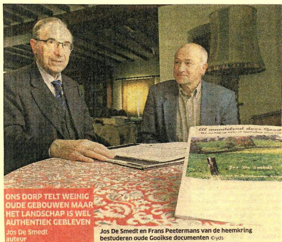
ONS DORP TELT WEINIG OUDE GEBOUWEN MAAR HET LANDSCHAP IS WEL AUTHENTIEK GEBLEVEN Jos De Smedt auteur