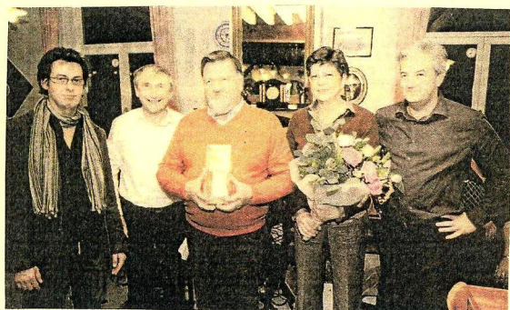
Boek over Pajotten in het Franstalig onderwijs