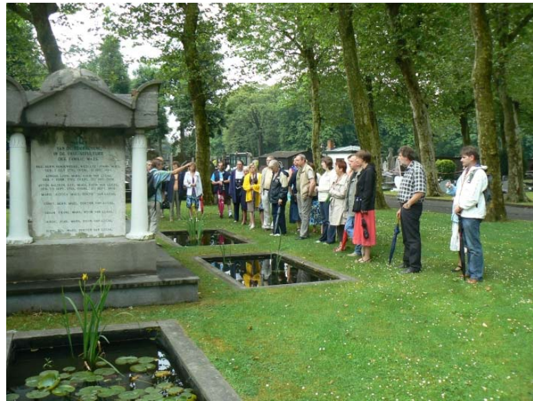
Gent Westerbegraafplaats