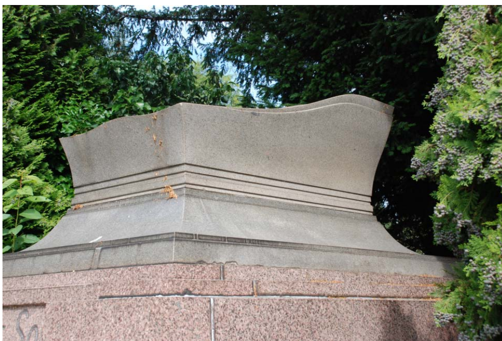
Grafteken van de familie Solvay te Elsene naar ontwerp van V. Horta

Museum voor Grafkunst, O.L.V. - Voorplein 16, 1020 Laken