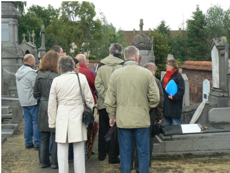
Lokeren stedelijke begraafplaats