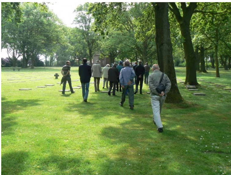
Menen Duitse oorlogsbegraafplaats