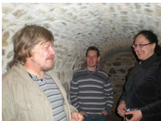
Medewerkers aan het funerair project Poperinge