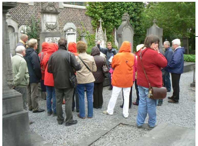
Sint-Amandsberg Campo Santo