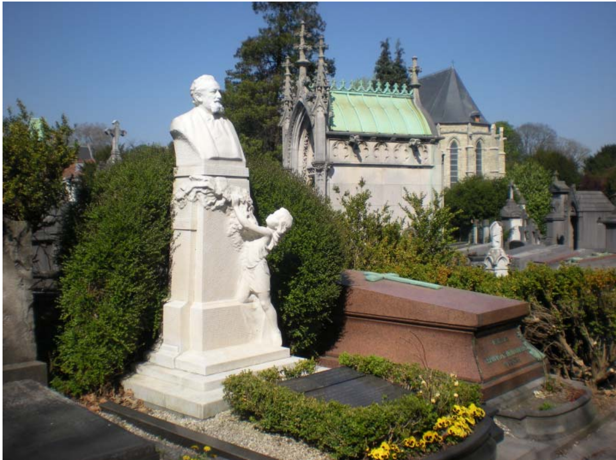
Kerkhof Laken, foto Anne-Mie Havermans

Het graf van Ernest Salu III, met de beeltenis van Ernest Salu I, ontworpen en uitgevoerd door Ernest Salu II, met het dochtertje van Salu II dat bloemen aanbedt.