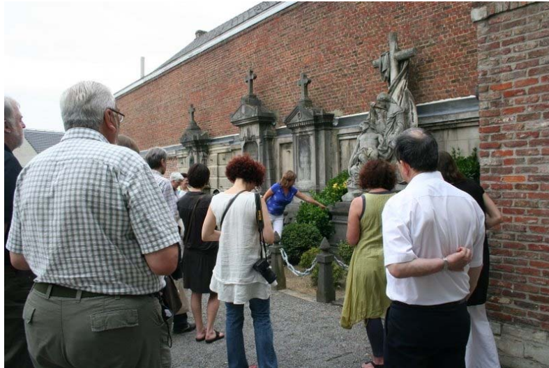
Leuven kerkhof Vlierbeek

Ze ligt al een tijdje achter ons, maar graag blikken we nog even terug op de derde editie van de Week van de begraafplaatsen. Overal in Europa stond eind mei-begin juni het funerair erfgoed centraal. Ook bij ons in Brussel en Vlaanderen, en dit dankzij de samenwerking tussen vzw Grafzerkje en Epitaaf vzw. Tot onze tevredenheid kunnen we stellen dat het funerair erfgoed in de lift zit. Meer en meer wordt aandacht geschonken aan onze begraafplaatsen en een stijgend aantal steden en gemeentes schreven zich in om hun begraafplaats open te stellen voor het publiek.