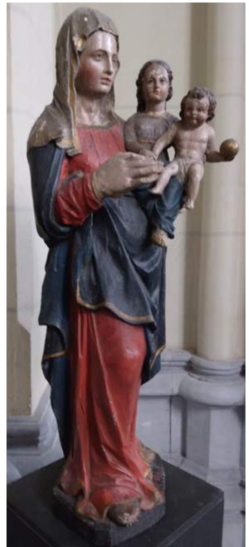
Afb. 11. Anoniem, Beeld van Sint-Anna-ten-Drieën, XVIIe E, gepolychromeerd hout, h 81 cm

tuur, in tegenstelling tot de gebruikelijke flamboyante en dramatische vormgeving van de contrareformatie. De sculptuur sierde het altaar van Sint-Anna in de voormalige parochiekerk van Laken. Het is echter niet ondenkbaar dat het bij wijlen, of permanent, in de Sint-Annakapel heeft gestaan aan het begin van de gelijknamige dreef. 12