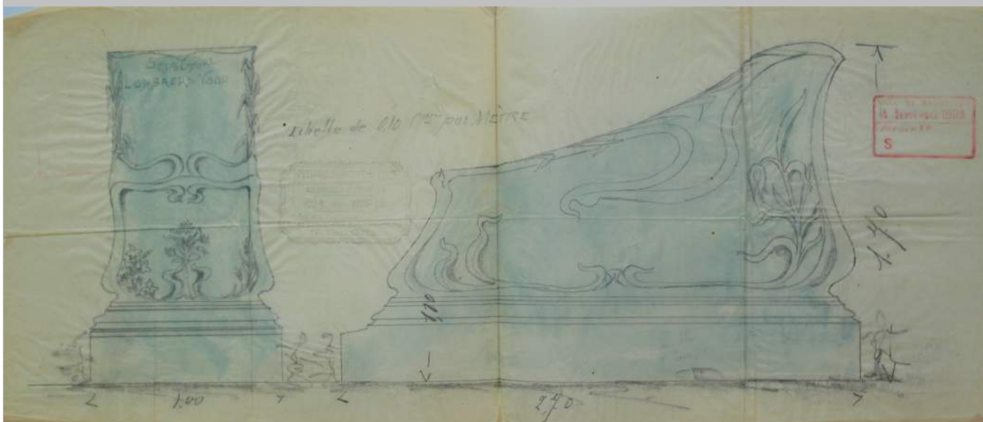
Ontwerp voor het grafteken van de familie Lombaers naar een ontwerp van Pierre Dupont & Fils uit 1903, Stad Brussel, dossier 2235.

VAN ZODRA DE MEDIA (WEBSITE, AFFICHES, FOLDER) KLAAR ZIJN HOUDEN WE JULIE OP DE HOOGTE VIA ONZE SOCIALE NETWERKEN EN NIEUWSBRIEF, WANT INSCHRIJVEN IS VERPLICHT EN DIENT SNEL TE GEBEUREN, DE PLAATSEN ZIJN IMMERS BEPERKT.