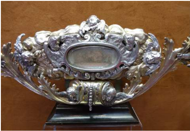
Afb. 9. Anoniem, Reliekhouders van de miraculeuze draad van Onze-Lieve-Vrouw van Laken, XVIIe E, verguld (sterling) zilver. 22 x 56 cm