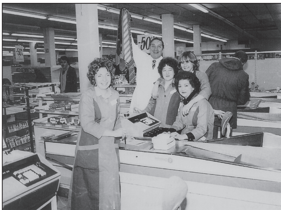
Le personnel de SARMA

Passant par ce carrefour, chaussée d'Alseberg et rue Xavier de Bue, pour mon travail (j'étais encaisseur à la Banque de Bruxelles, secteur Uccle), je vis un gros attroupement de personnes devant le magasin SARMA (actuellement HEMA).