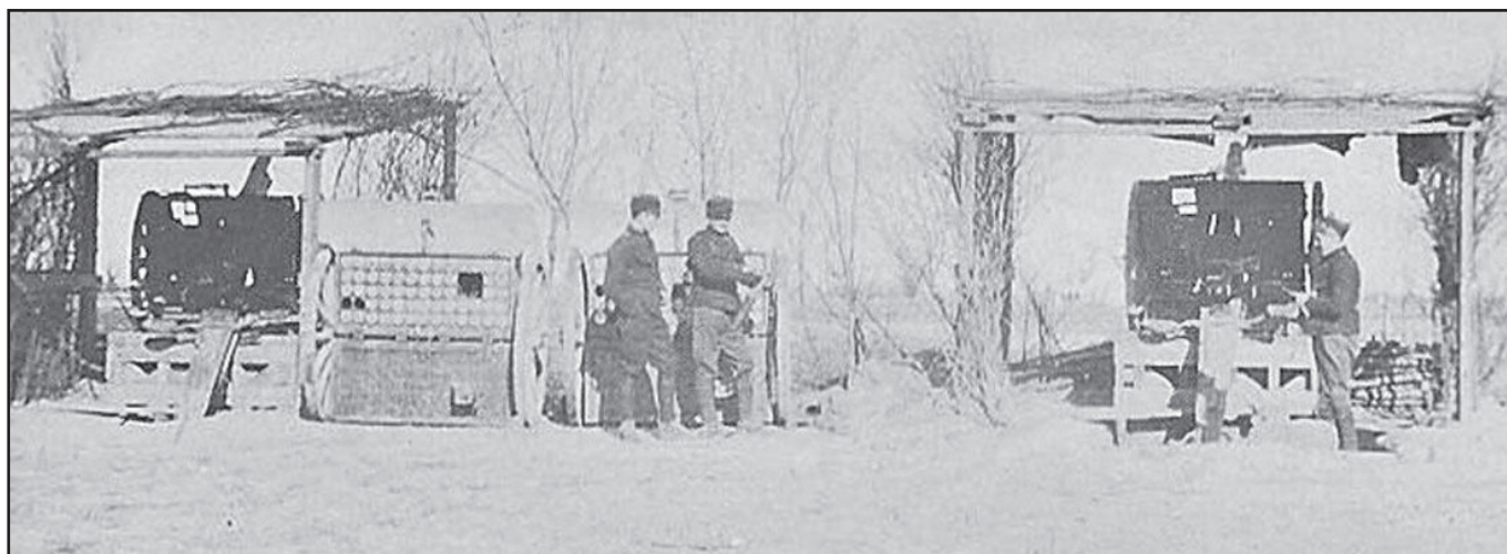
« Canons de 7.5 contre avions » « 2 »