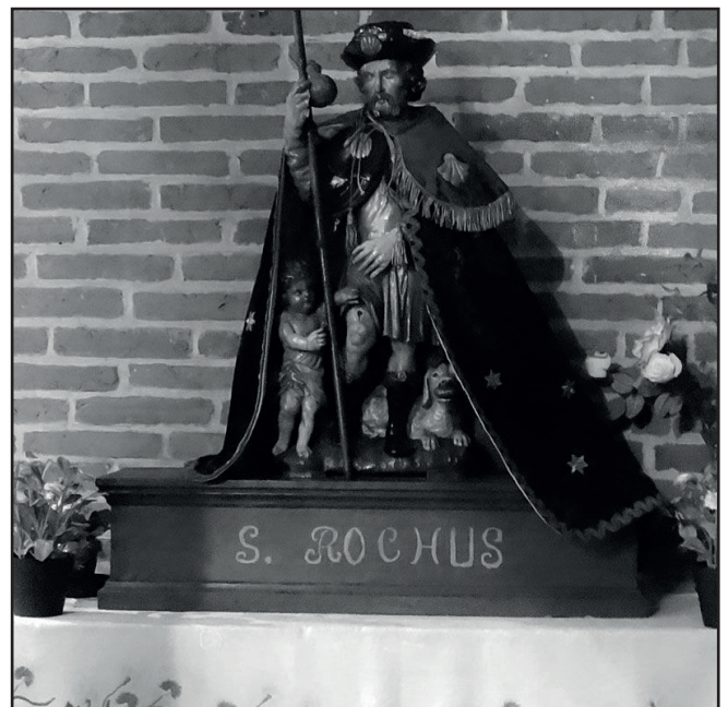
Inauguration du manteau de saint Roch restauré (lundi 5 juin 2017) : la statue porte pour la première fois le manteau restauré.

Nous ne reviendrons plus sur l'histoire du manteau de saint Roch largement évoquée dans notre précédent numéro. La présentation du manteau restauré s'est faite le lundi de Pentecôte, après la messe traditionnelle, jadis ponctuée par la « procession de Stalle » au cours de laquelle la statue de saint Roch était transportée. A l'occasion de cette messe, le manteau rénové a