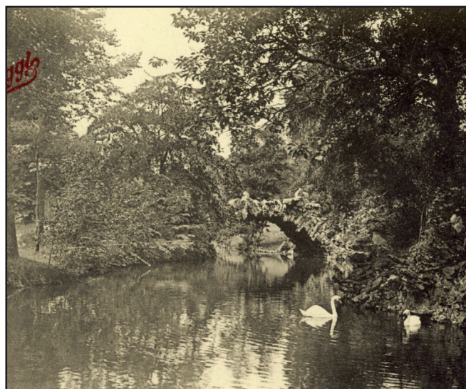
L'étang de l'ancienne propriété Raspail, et non pas celui du parc Raspail, l'un et l'autre proches de la rue de Stalle, aux environs de la chapelle.

Notre vice-président, Eric de Crayencour, a relevé une erreur dans notre précédent numéro (265). La légende d'une des illustrations de l'article consacré à la rue de Stalle est en effet erronée. La photo (p. 18) qui montre un étang traversé par un pont rustique ne représente pas la pièce d'eau du parc Raspail, en réalité beaucoup plus petite, mais bien celle de l'ancienne propriété Allard, voisine, aujourd'hui disparue.