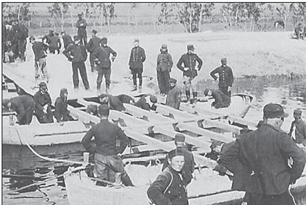
« Canal de Loo exercice de pontage » « 11 »