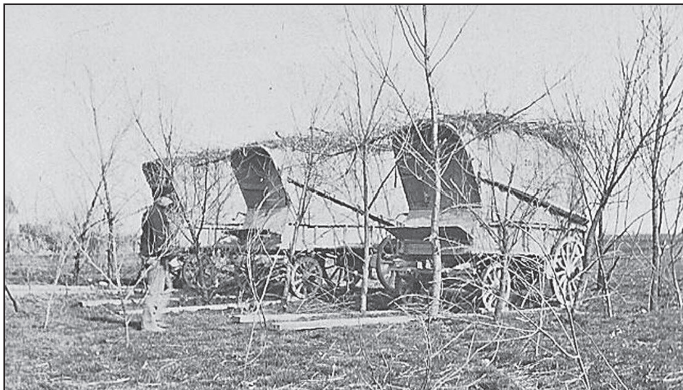
« Voitures du génie » « 2 »