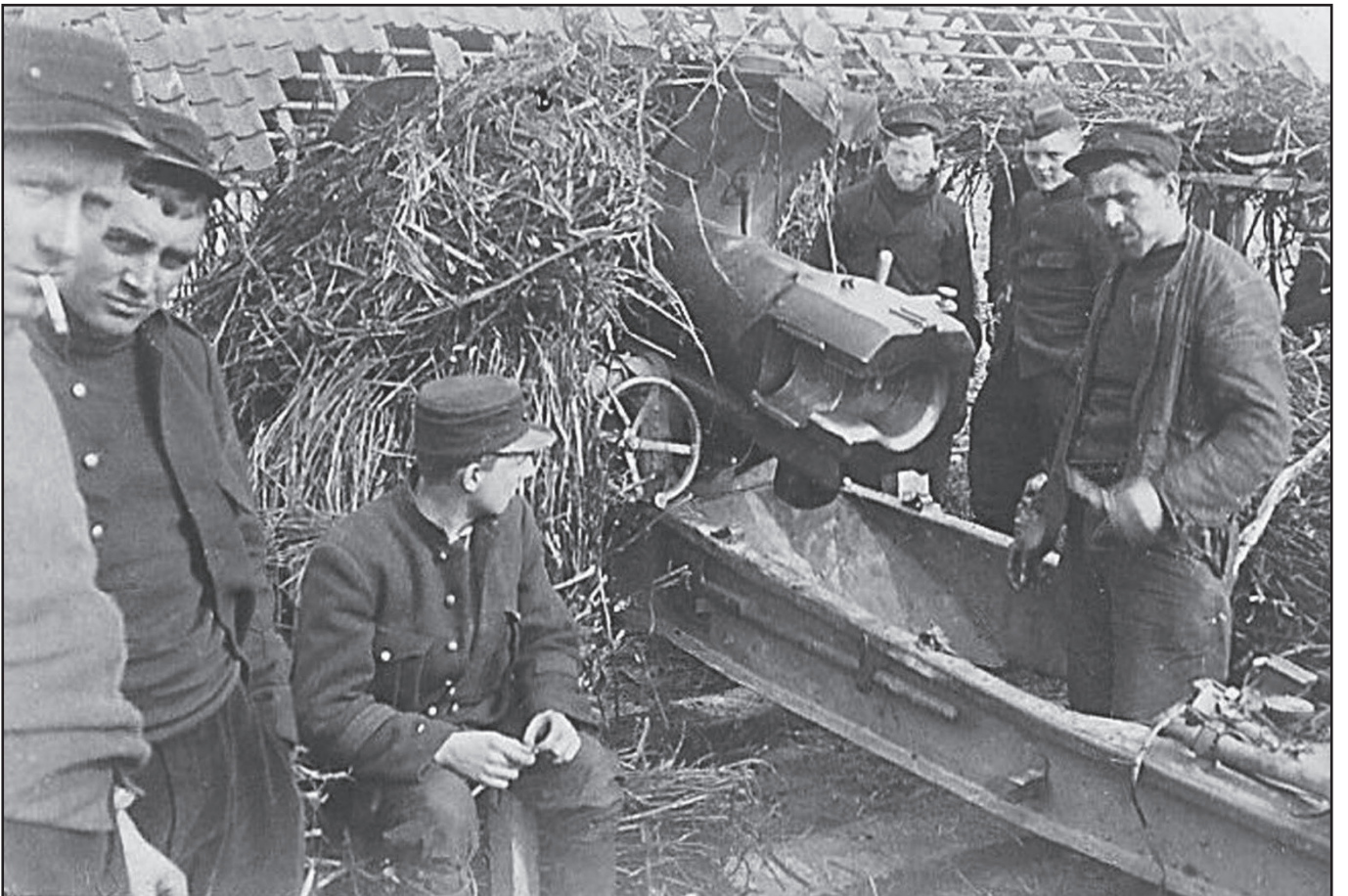
« 1 » (?)