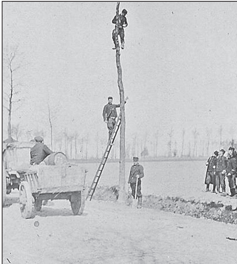
« Pose des fils de téléphonie » « 8 »