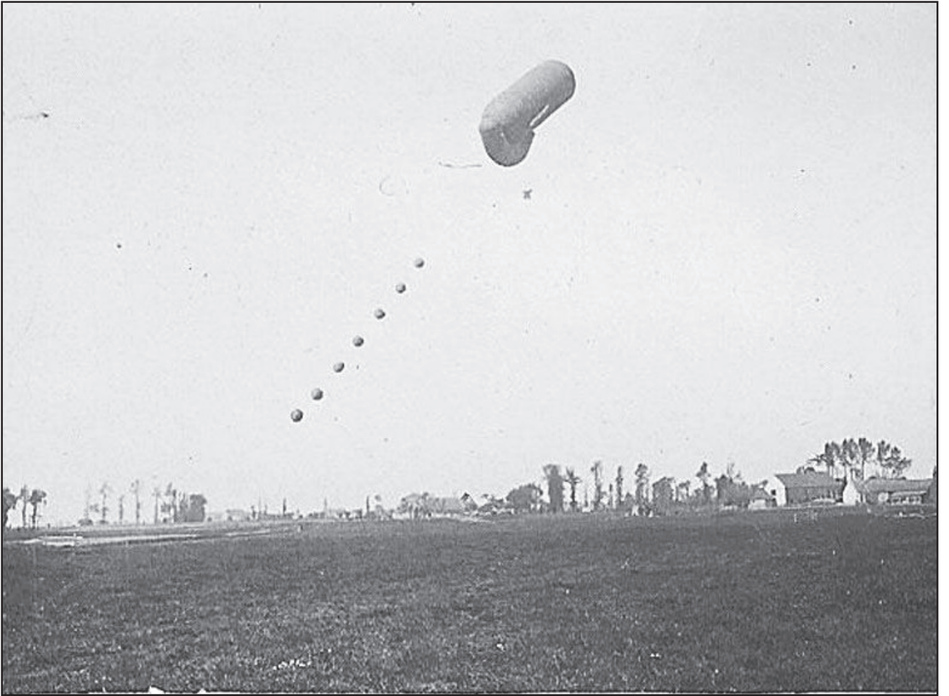
« Drachen ballon belge » « 3 »