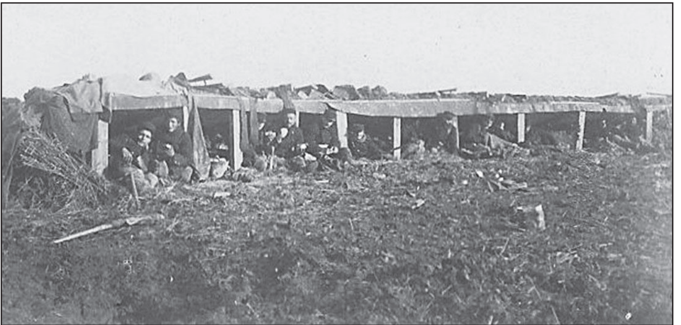
« 1 »