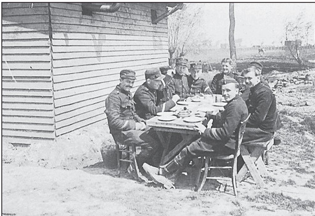
« 1 »