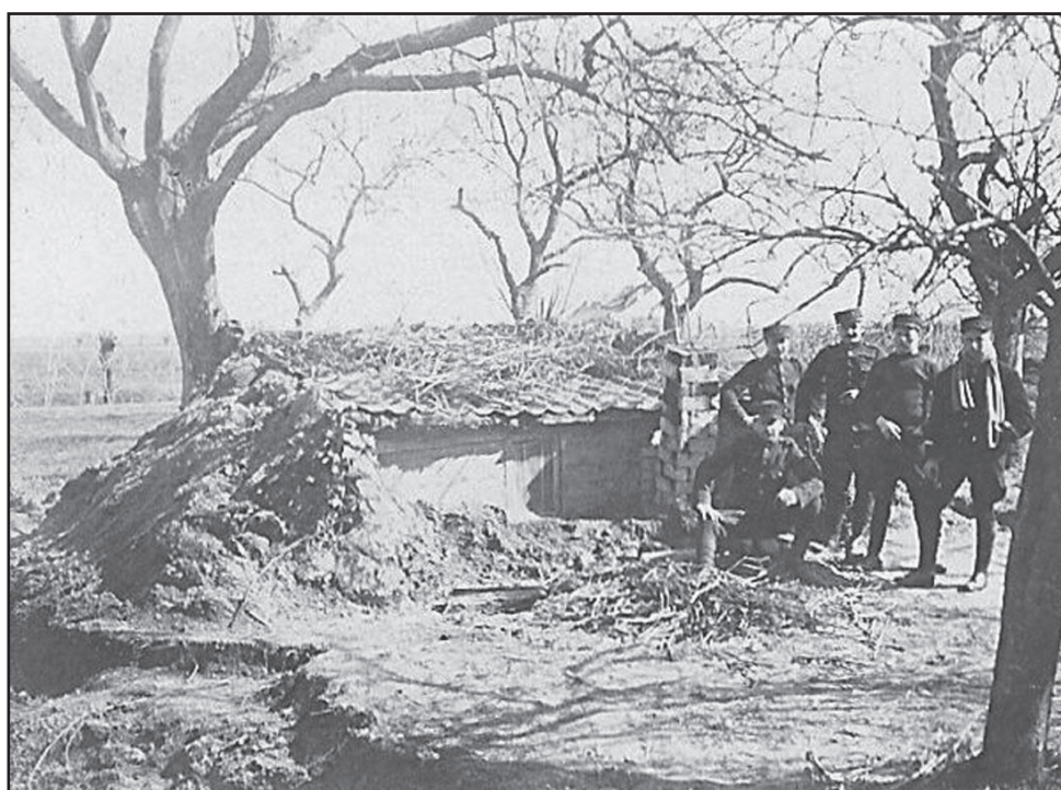
« 1 »