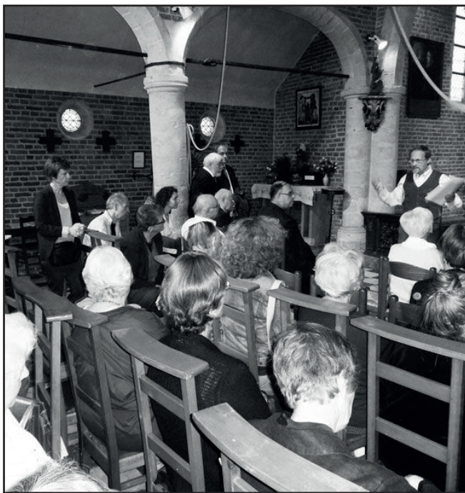
Inauguration du manteau de saint Roch restauré (lundi 5 juin 2017) : la statue porte pour la première fois le manteau restauré.