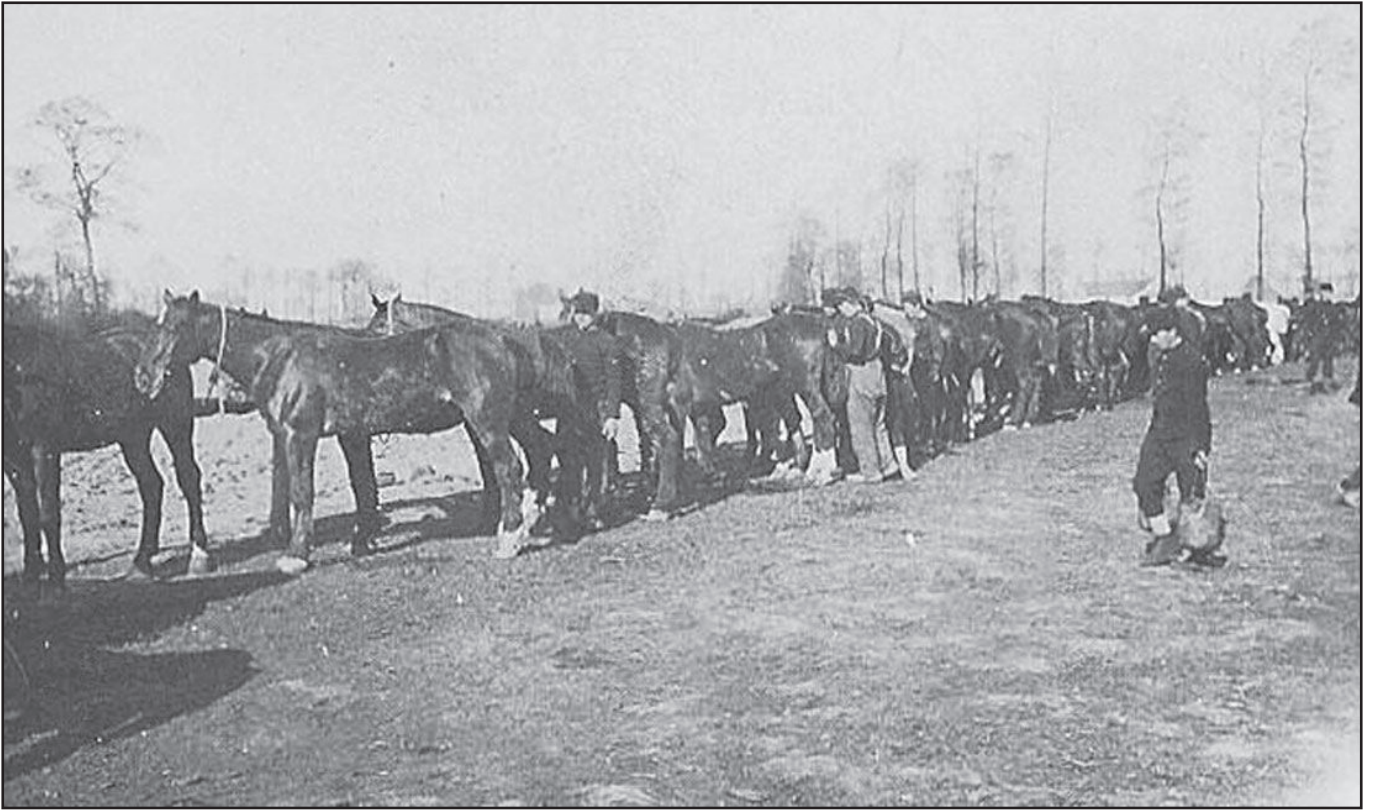
« Le pansage » « » « 6 »