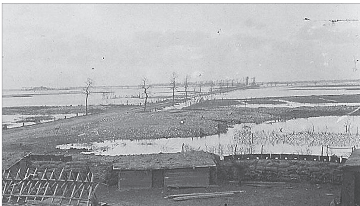
« Pervyse panorama pris de la gare inondations de la route d'Ostende » « 8 »