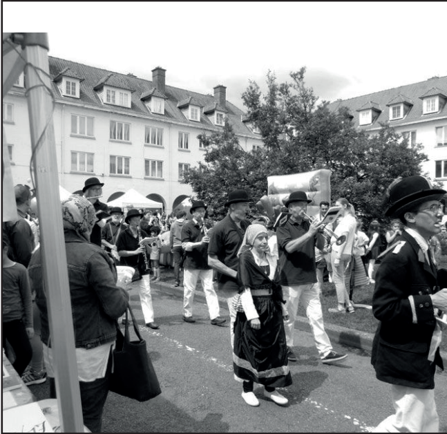
Fête du Homborch (21 mai 2017) : le passage du cortège avec la fanfare « Les chasseurs de prinkères ».

Comme chaque année, nous avons participé à la fête du Homborch, devenue avec le temps