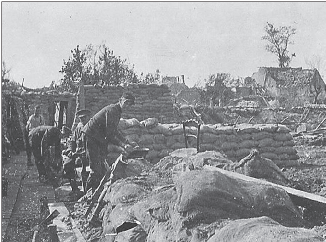
« Derrière la digue, route de Dixmude à Caeskerke 25 septembre 1915 » « 11 »