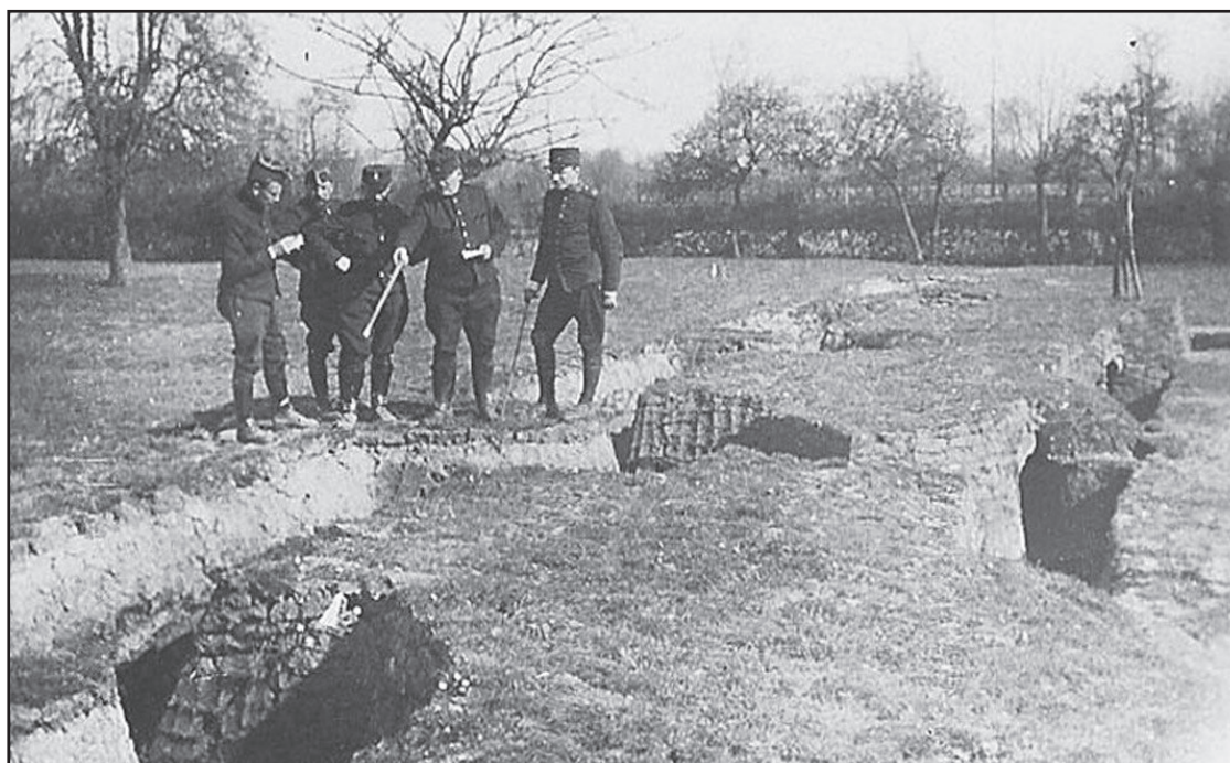
« Tranchées de repli » « 11 »