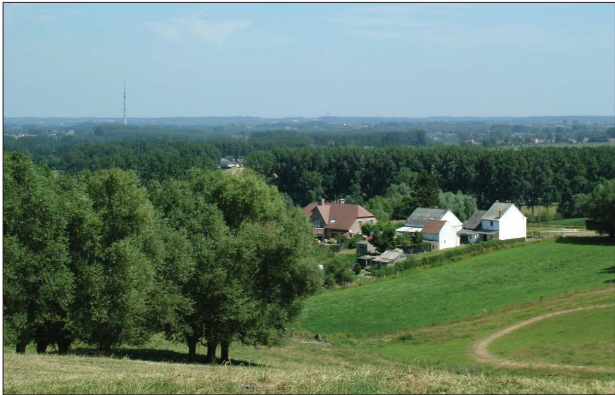
Zicht op het oosten van de Kesterheide.