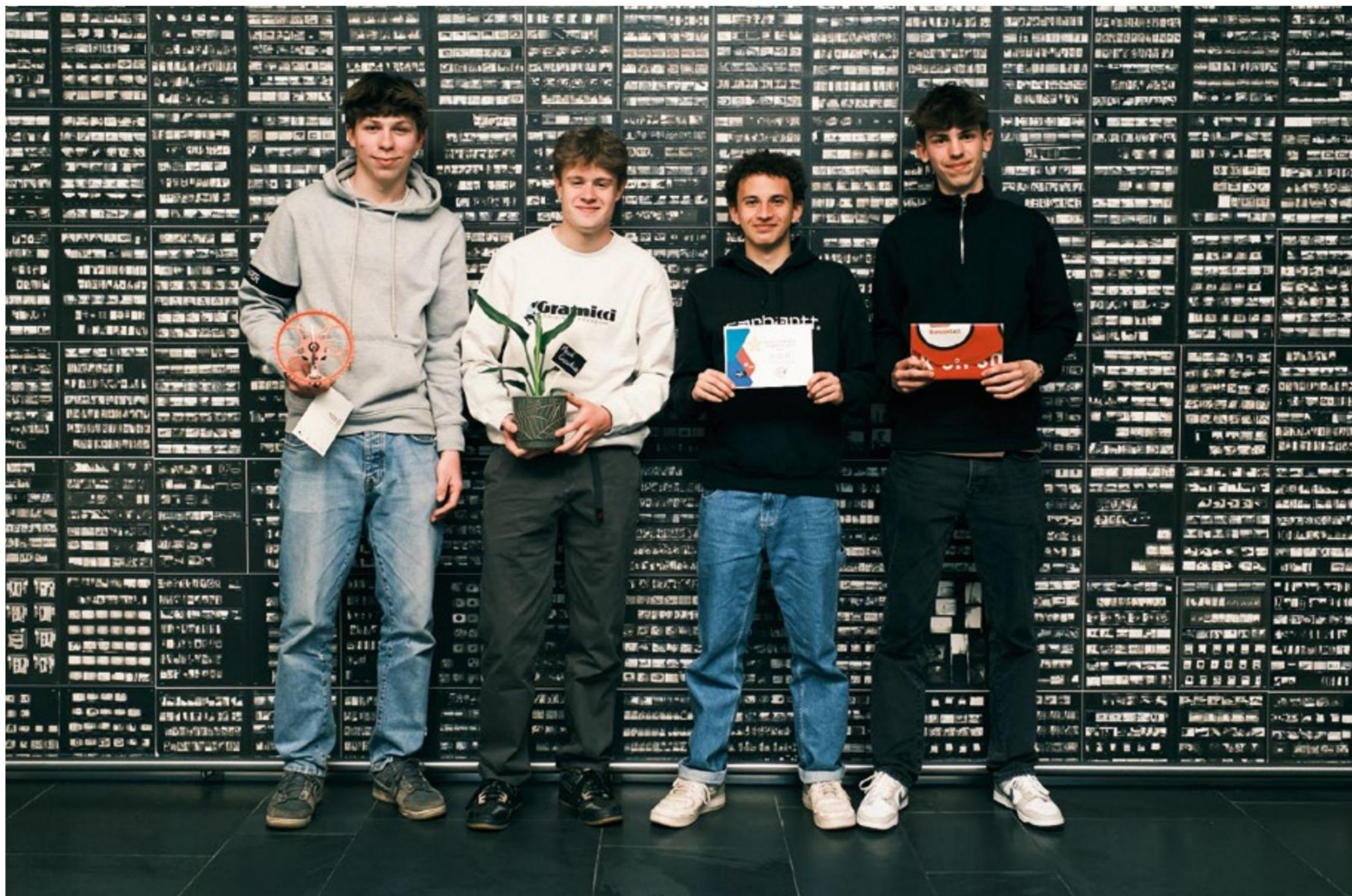
Het team ontving geupcyclede cadeautjes van People Made. De provincie regelde ook een bezoek aan maatwerkbedrijf De Vlaspit dat kurk recycleert.

De provincie kende een subsidie van 25.080 euro toe aan VOKA voor de organisatie van de miniondernemingen via Vlajo.